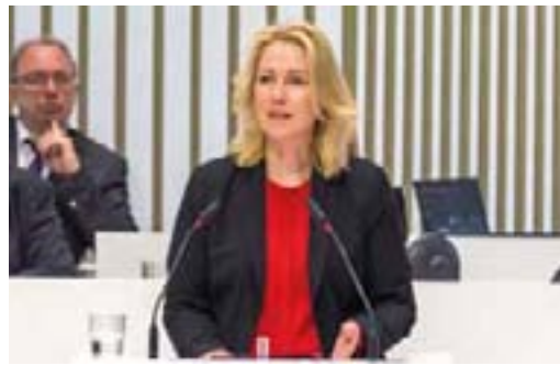
Ministerpräsidentin Manuela Schwesig (SPD)