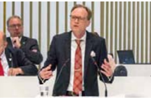
Jochen Schulte (SPD)