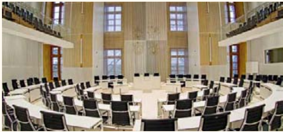
Vor einem Jahr noch Baustelle - jetzt der neue Plenarsaal des Landtages

Rote Marmortreppe, 3. Stock Journalisten informieren über ihre Arbeit als Politik-Berichterstatler.