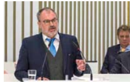
Christoph Grimm (AfD)