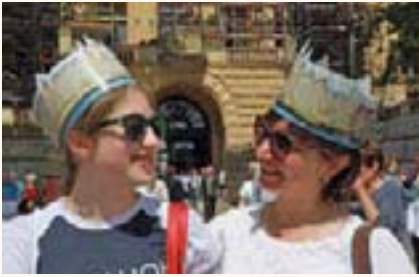
Am 17. Juni zu erleben: Das Schweriner Schloss als Sitz des Landesparlamentes!