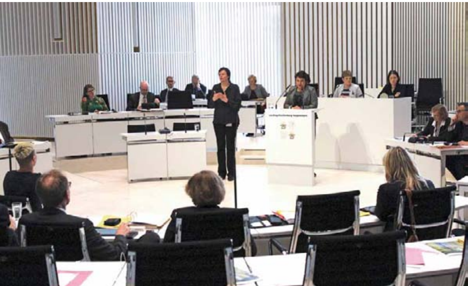
Für die Debatte zum Thema UN-Behindertenrechtskonvention hatte der Landtag zwei Gebärdendolmetscherinnen engagiert.