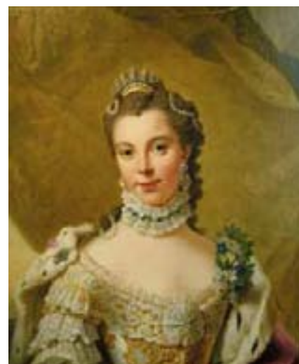
Prinzessin Sophie Charlotte Herzogin zu Mecklenburg-Strelitz

Geboren wurde Sophie Charlotte am 17. Mai 1744. In der Abgeschiedenheit der Mecklenburgischen Seenplatte verlebte die Herzogin zu Mecklenburg-Strelitz eine Kindheit in relativ bescheidenen Verhältnissen, bevor sie am 8. September 1761 den ihr bis dahin unbekanntem König Georg III. heiratet und damit Königin von Großbritannien und Irland wird. Zwar sagen Zeitgenossen Sophie Charlotte mangelnde Bildung nach, tatsächlich setzt sie sich jedoch unter anderem für Kultur und Bildung ein, stiftet Krankenhäuser, lässt eine Stickschule für Waisenmädchen errichten und fördert Künstlerinnen. Sie interessiert sich sehr für Botanik und trägt mit dazu bei, dass die Royal Botanic Gardens eine umfangreiche Samenbank aufbauen können. Ihr zu Ehren wird