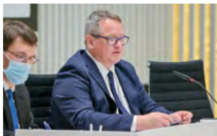
Ausschussvorsitzender Tilo Gundlack (SPD)