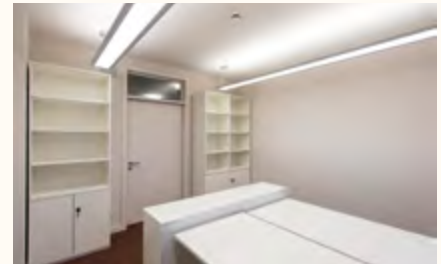
Im Zuge der Sanierung des Burgseeflügels wurden im 6. Obergeschoss neue Büros eingerichtet.

Bei den Arbeiten an der Decke des alten Plenarsaals wurde hinter der ehemaligen Garderobe im Bereich des Flurs am Zugang zum Präsidium eine Fachwerkwand gefunden. Mittels einer dendrochronologischen Untersuchung konnte