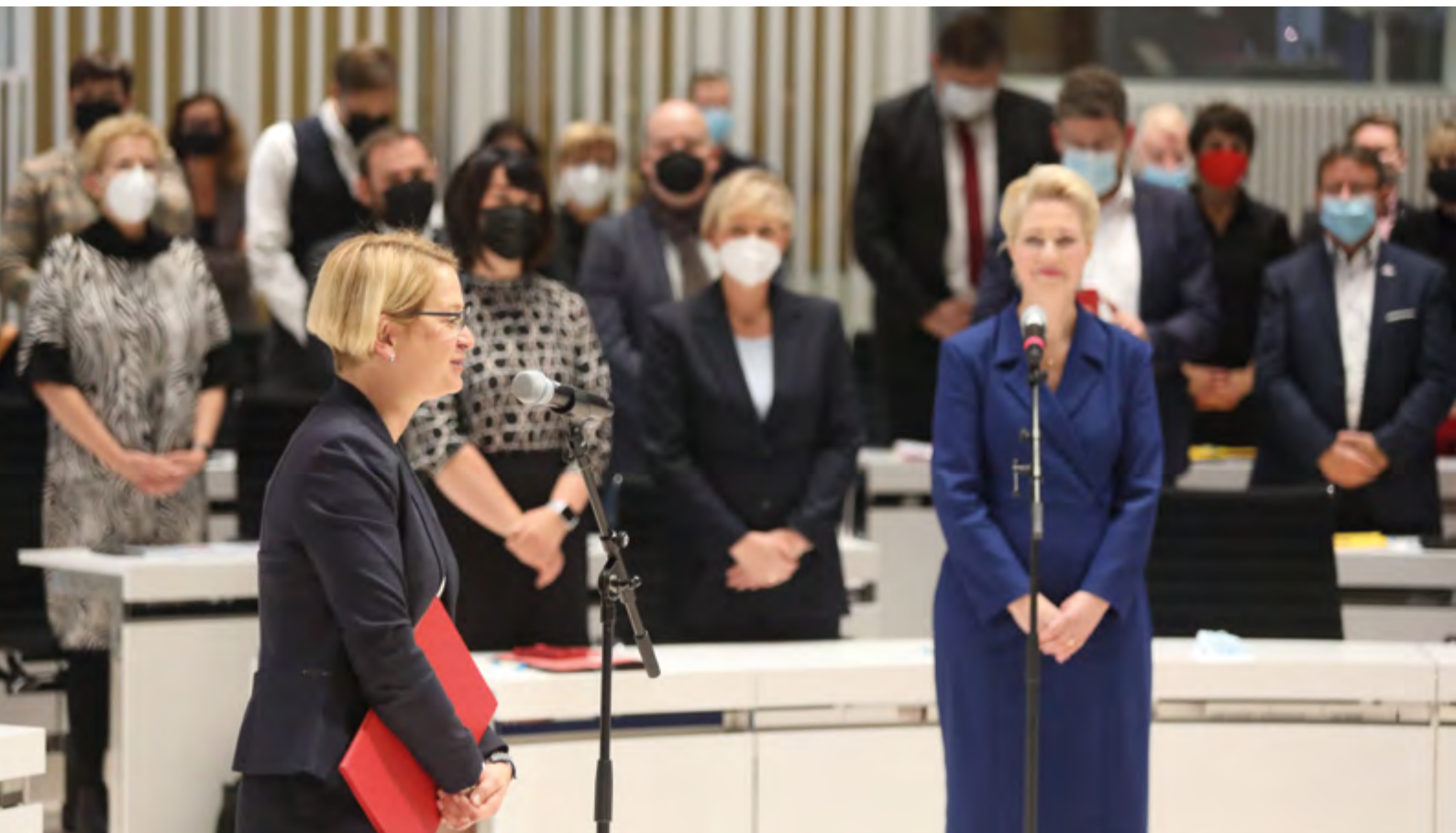
Landtagspräsidentin Birgit Hesse vereidigt die neu gewählte Ministerpräsidentin Manuela Schwesig.