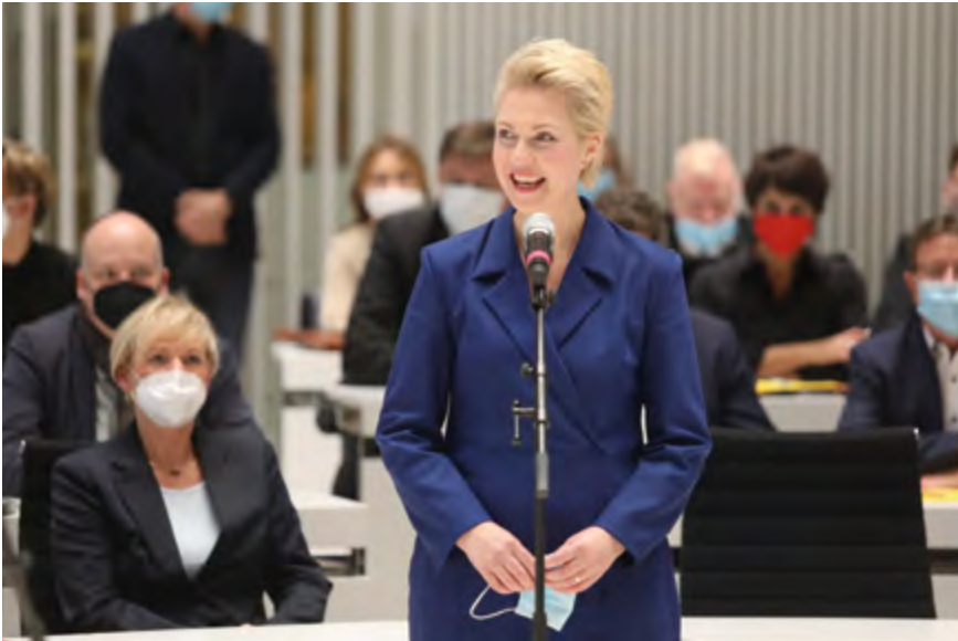
Ministerpräsidentin Manuela Schwesig während sie ihren Eid leistet.