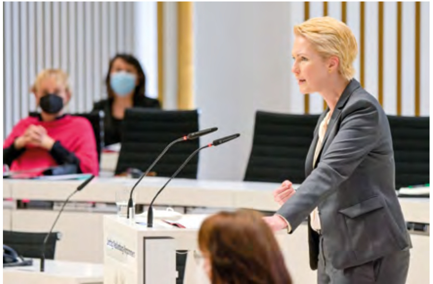
Ministerpräsidentin Manuela Schwesig