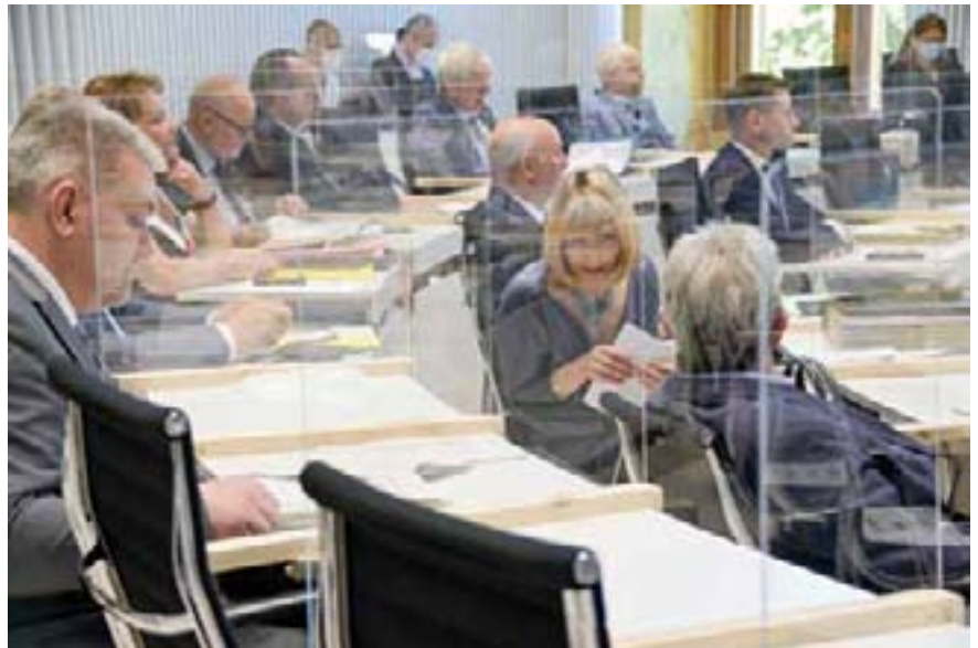
Abgeordnete der Fraktion CDU

„Die AfD hat von Beginn an versucht, und auch heute wieder, die Pandemie im Wesentlichen als ein Wahrnehmungs-