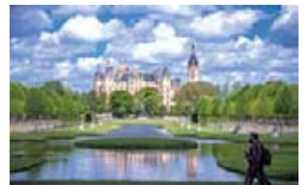
2014 hat die Kultusministerkonferenz (KMK) das „Residenzenensemble Schwerin – Kulturlandschaft des romantischen Historismus“ in die Vorschlagsliste aufgenommen.

Antrag CDU/SPD Drucksache 7/1593 Beschlussempfehlung Wirtschaftsausschuss Drucksache 7/6201