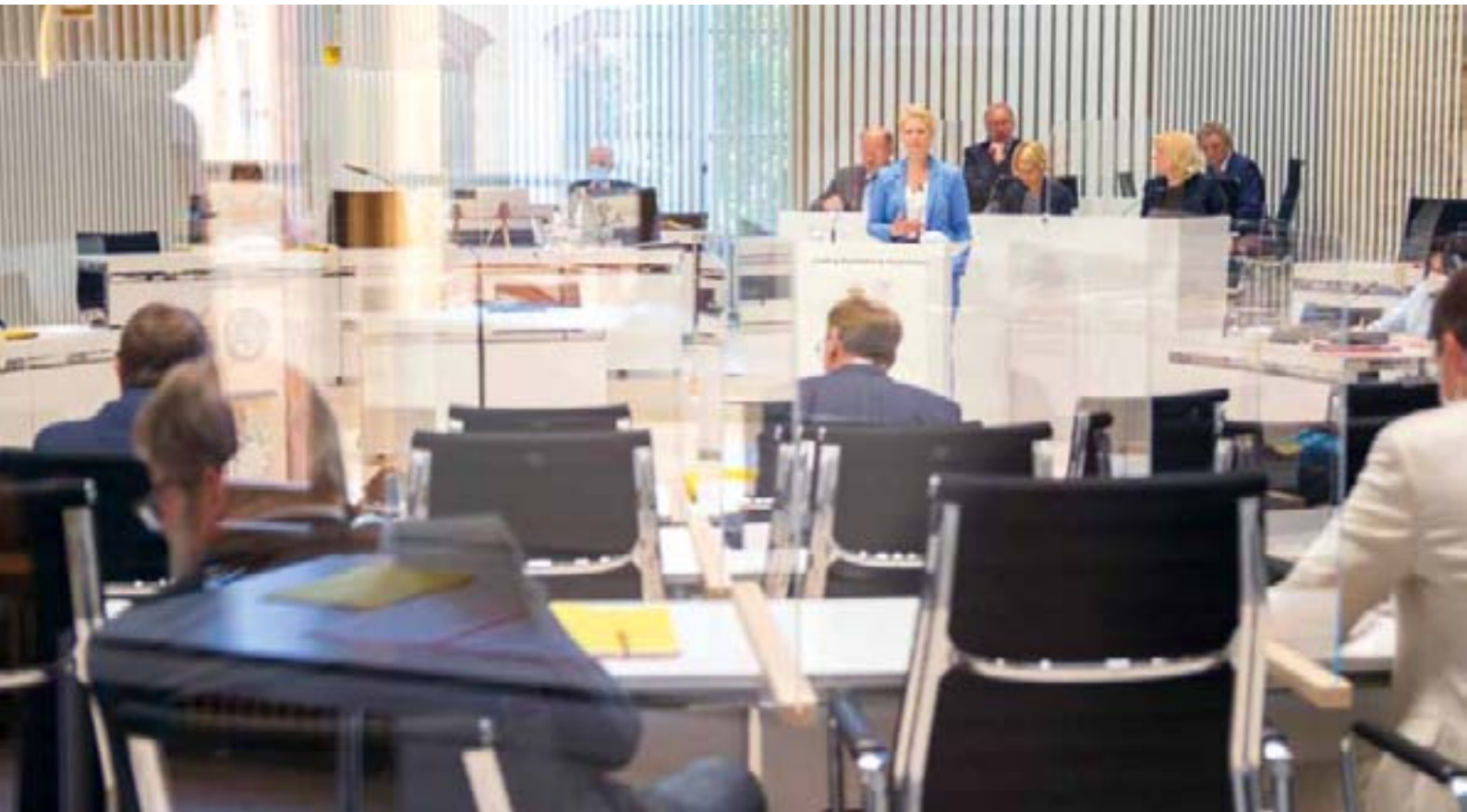
Ministerpräsidentin Manuela Schwesig während der Aktuellen Stunde am 11. Juni.