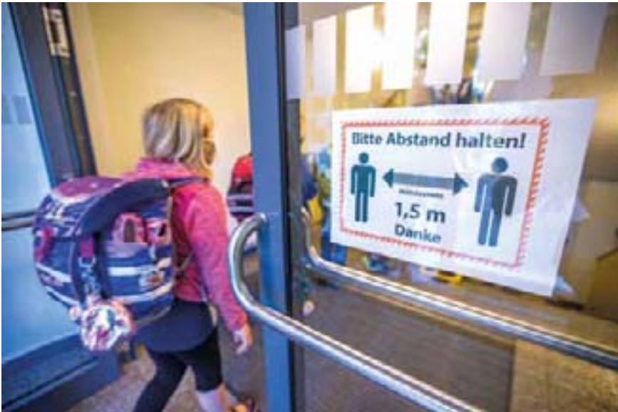
Seit Beginn der Corona-Pandemie ist der Alltag für Schülerinnen und Schüler stark eingeschränkt.

gesamte Schulsystem einer Inventur zu unterziehen. Das könne niemand alleine leisten. „Deswegen schlagen wir eine Bildungskonferenz aller an Schule Beteiligten vor.“ An deren Ende ein genauer Plan stehe: „Wann wird was durch wen unterrichtet, erarbeitet, geprüft und vor allem auch finanziert?“