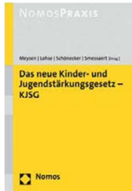
Das neue Fachbuch zum Kinder- und Jugendstärkungsgesetz