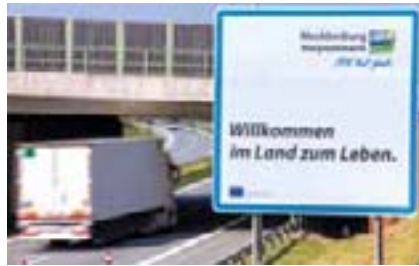
Schilder wie dieses heißen Reisende an den Landesgrenzen Mecklenburg-Vorpommerns willkommen.

Gesetzentwurf DIE LINKE Drucksache 7/5877