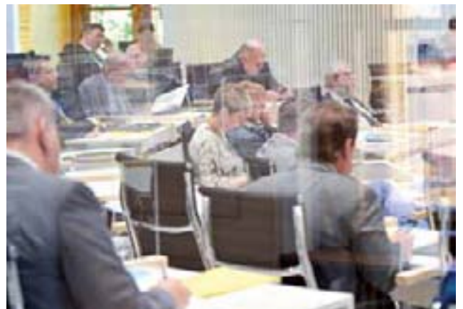
Abgeordnete der Fraktionen CDU und AfD

Und was ist denn nun die Voraussetzung für Wirtschaftswachstum? [...] Wir brauchen wettbewerbsfähige Unternehmen, [...], und dazu braucht es Unternehmertum, also Wagemut, Risikobereitschaft, Innovation, technischen und organisatorischen Fortschritt, Kreativität, Leistungsbereit-