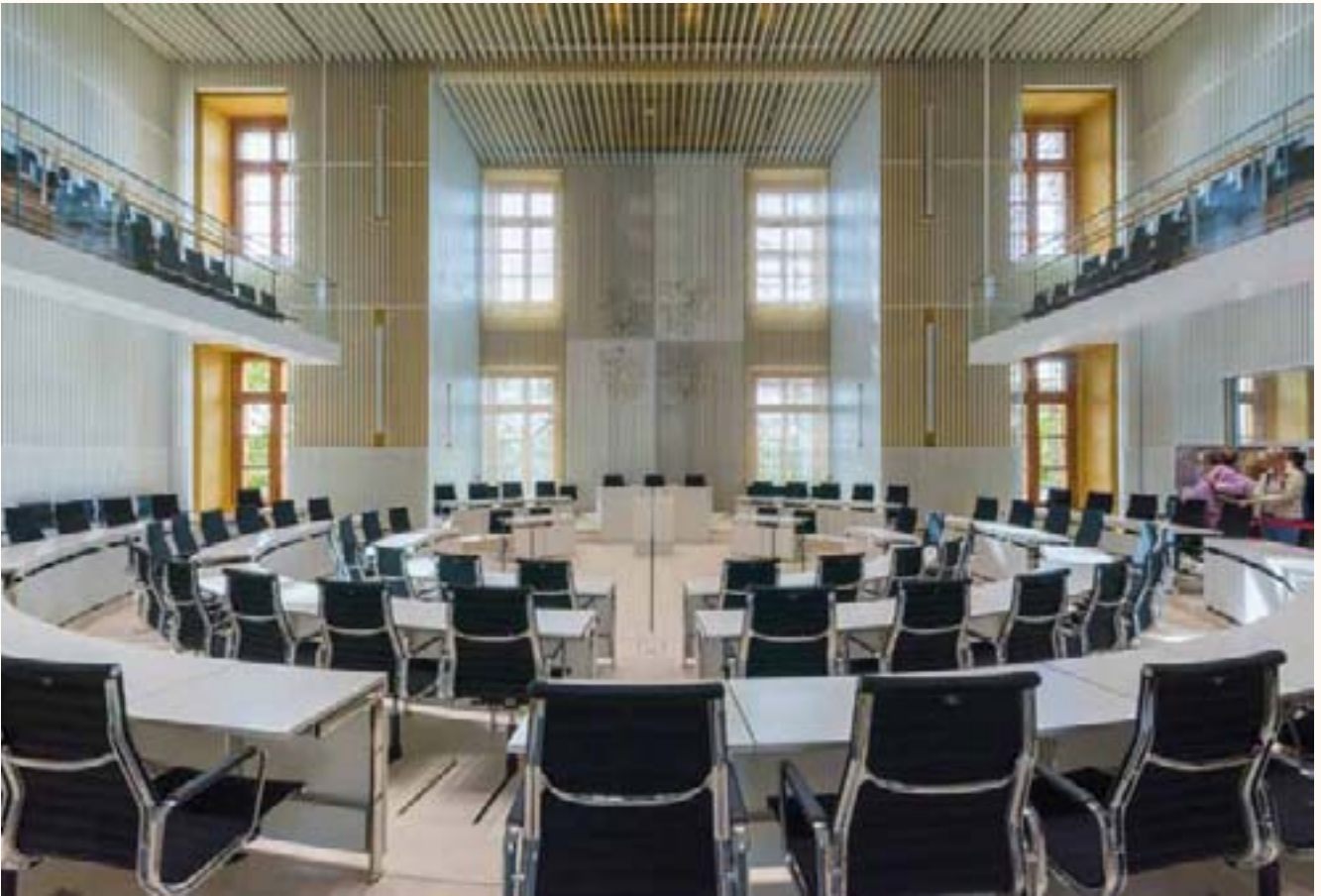
Im Plenarsaal des Schweriner Schlosses wird der neu gewählte Landtag tagen.