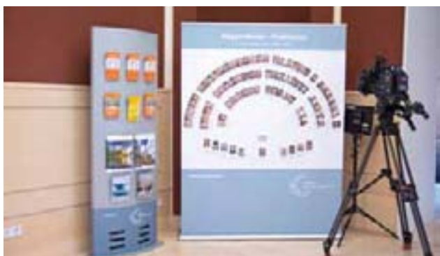
Abgeordnete - Fraktionen, 7. Legislaturperiode 2016 bis September 2021

[...] es war die SPD, die [...] die Hartz-Gesetzgebung eingeführt hat und den Arbeitsmarkt zulasten vieler Beschäftigter dereguliert hat. [...] Die sachgrundlosen Befristungen abzuschaffen, wäre eine gute Idee für gute Arbeit, allerdings sah