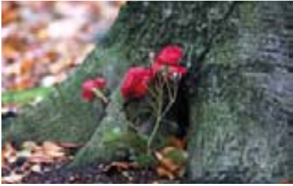
Die in Deutschland geltende Friedhofspflicht schließt Bestattungen auf See und in ausgewiesenen Waldgebieten ein.