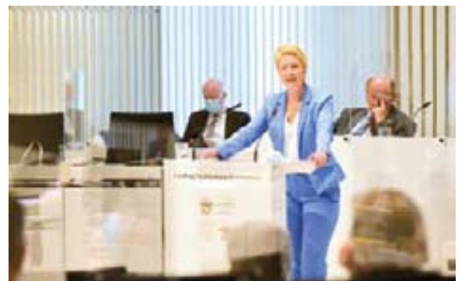
Ministerpräsidentin Manuela Schwesig

(Beifall vonseiten der Fraktion der SPD)