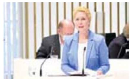
Ministerpräsidentin Manuela Schwesig

■ Mittwoch, 9. Juni: Die Abgeordneten starten in die letzte reguläre Sitzungswoche ihrer Wahlperiode. Der erste der drei Sitzungstage beginnt dabei nicht wie üblich mit einer Aktuellen Stunde; diese wurde auf den letzten Sitzungstag verlegt. Zu Beginn hält stattdessen Ministerpräsidentin Manuela Schwesig eine Regierungserklärung. Es ist die dreizehnte ihrer Amtszeit und die elfte zu Corona. Flankiert wird die Aussprache dazu von zwei Anträgen. Sowohl SPD/CDU als auch DIE LINKE nehmen darin insbesondere Kinder, Jugendliche und die Wirtschaft in den Blick und fordern, sie mit den Folgen der Pandemie nicht allein zu lassen. Im Grundsatz stellen sich alle drei Fraktionen hinter die Corona-Politik der vergangenen Monate. Die AfD lehnt sie nach wie vor ab.