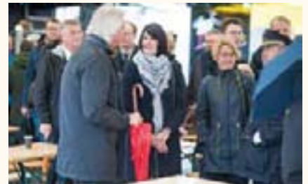
Bei Starkregen und Wind suchten viele Abgeordnete auf dem Neuen Markt Schutz unter einem Zelt, darunter auch Landtagspräsidentin Birgit Hesse (2. v.r.).