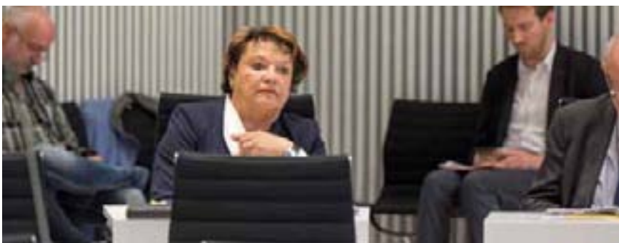
Die fraktionslose Abgeordnete Christel Weißig