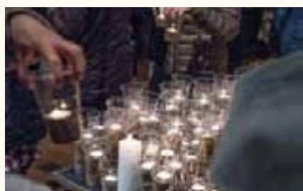
Kerzen als Zeichen des Gedenkens an die friedliche Revolution.

„Viele fragen sich: Was ist eigentlich geblieben von jenem Elan, von jener ungeheuren Kraft, die die Menschen damals in dieser friedlichen Revolution aufbrachten?“