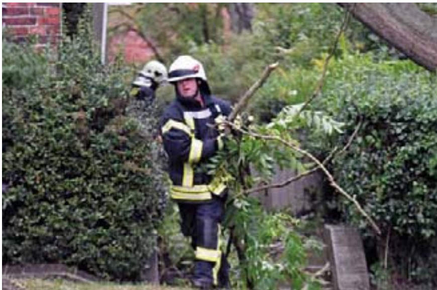
Wie viele andere Ehrenamtliche sind die Helfer der Freiwilligen Feuerwehr unverzichtbar.