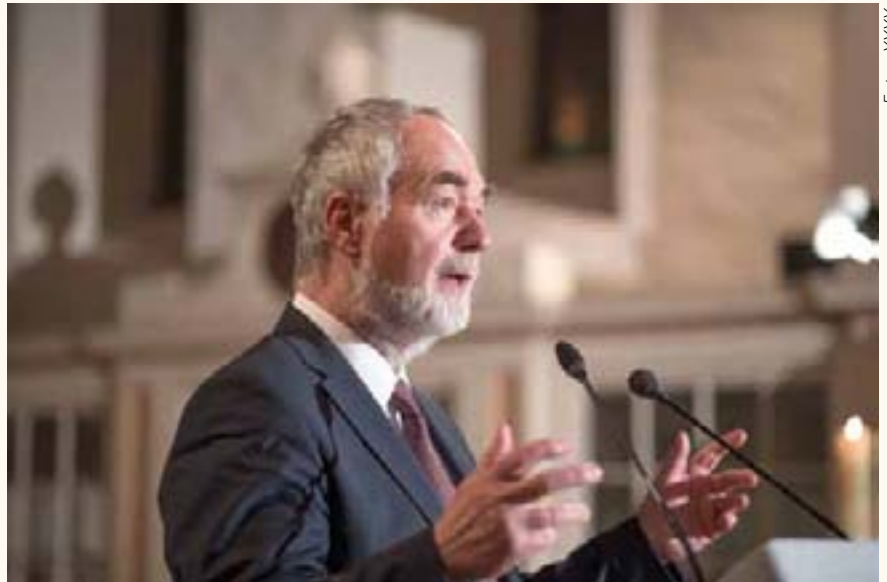
Festredner Markus Meckel

Meckel beklagte, dass in Gedenkreden der Vergangenheit oft der Eindruck entstand, als hätte die SED die Mauer geöffnet und dann Kanzler Helmut Kohl die Einheit geschaffen: „Ich finde mich in solchen Reden nicht wieder. Meine Geschichte ist eine andere, und sie geht so: Erst wurde in einer gewaltfreien Revolution im Zusammenspiel von neuen demokratischen Vereinigungen und den Massen auf den Straßen die Diktatur gestürzt. In einem friedlichen