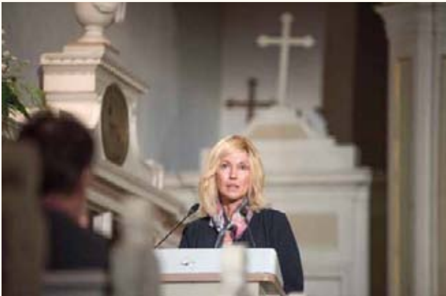
Ministerpräsidentin Manuela Schwesig