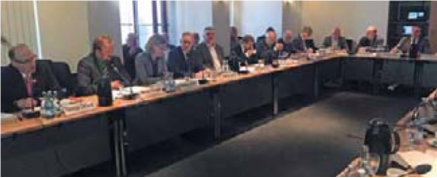
Die Sachverständigen zum Thema Krankenhausfinanzierung