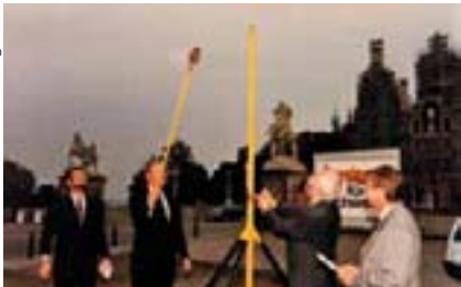
1991 – Das Schweriner Schloss als künftiger in der Verfassung von 1994 festgeschriebener Sitz des Landtages erhält Erdgas.