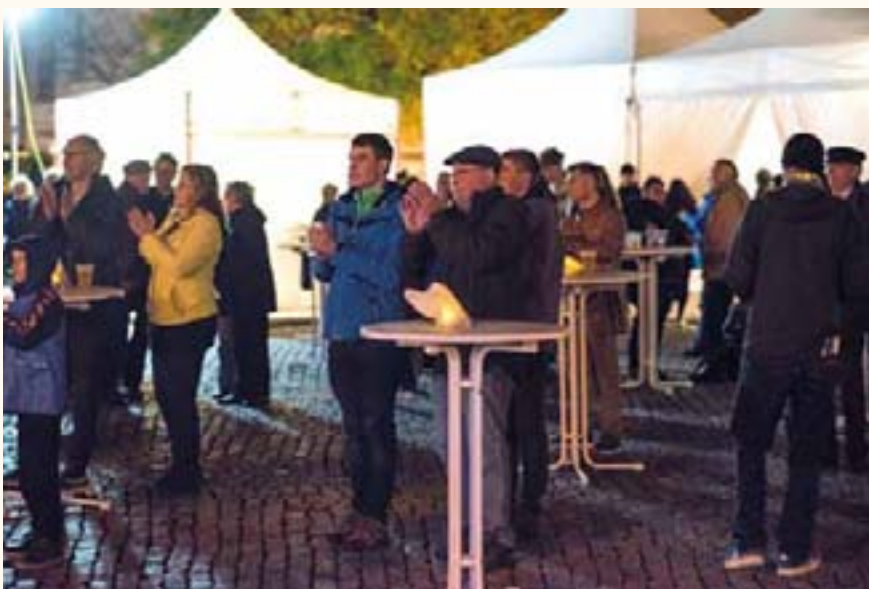
Zum Ausklang kamen viele Gäste auf dem Neuen Markt zusammen.

Gegen Ende seiner Rede ging Meckel darauf ein, dass er vor 30 Jahren dafür eingetreten war, über das Grundgesetz intensiv zu verhandeln und es möglicherweise mit Änderungen als gesamtdeutsche Verfassung zu beschließen.