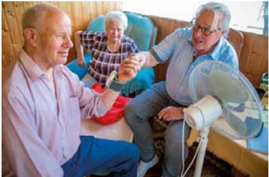
Viele Pflegebedürftige wünschen sich eine Pflege in den eigenen vier Wänden.