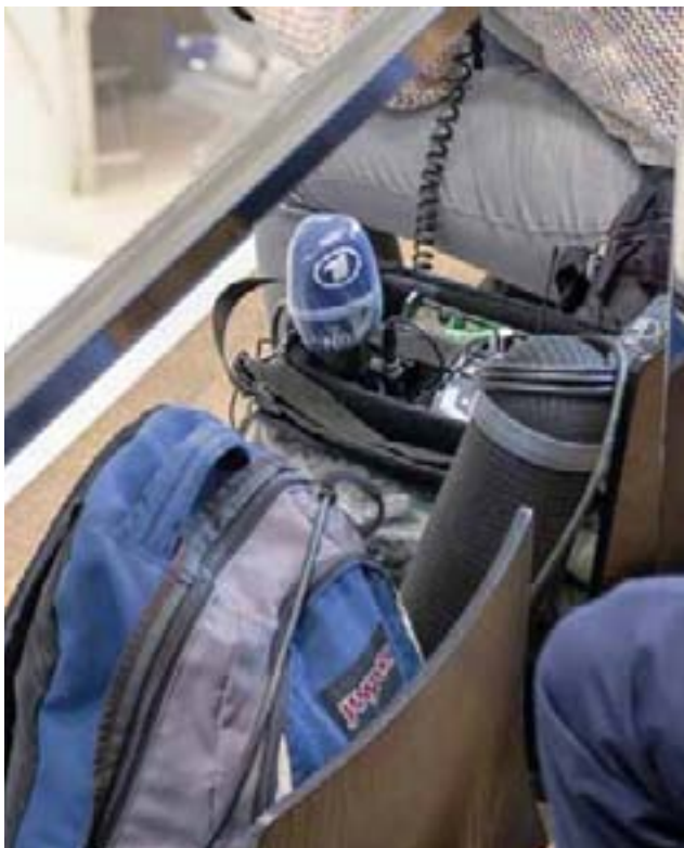
Pressebeobachter*innen sind immer dabei.