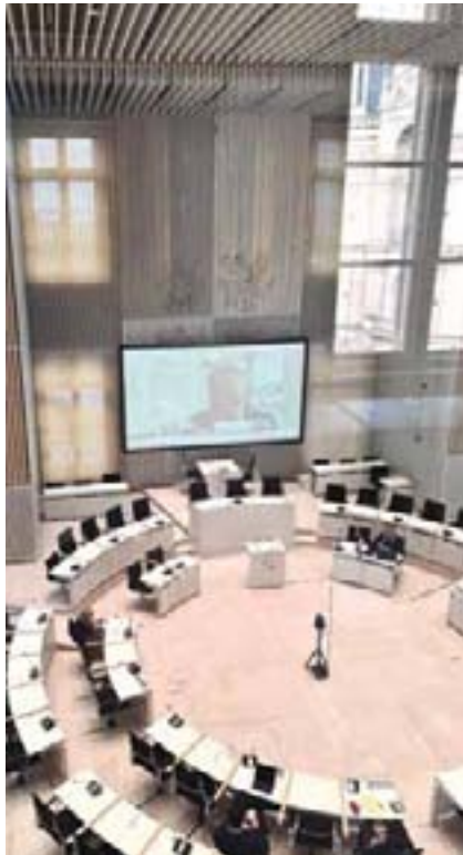
Die 15. Sitzung der Enquete-Kommission „Zukunft der medizinischen Versorgung in MV“ fand als Hybrid-Veranstaltung statt.

In der Sitzung der Enquete-Kommission zeigte sich, dass in weiten Teilen des Landes ein erheblicher Ausbaubedarf an Mobilitätsangeboten besteht, da keine ausreichende, flächendeckende