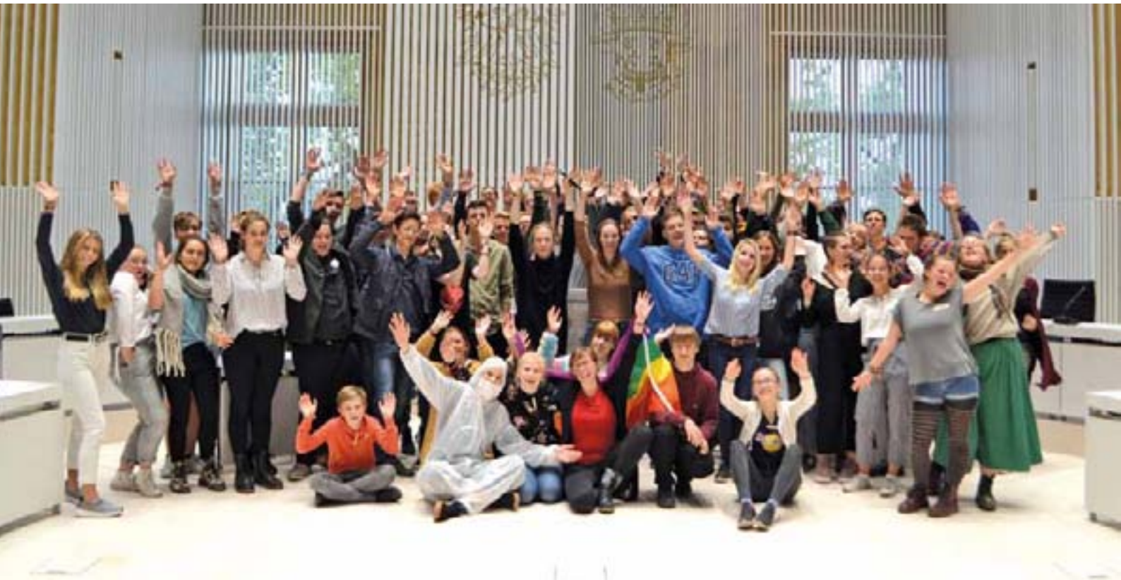
Bei den Beteiligungsformaten „Jugend im Landtag“ und „Jugend fragt nach“ kommen Jugendliche mit Abgeordneten im Landtag MV ins Gespräch.