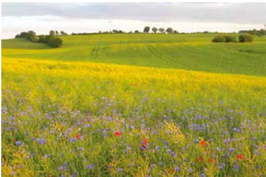
Die Randstreifen eines Feldes, sogenannte Feldraine, dienen Insekten als Lebensraum.

uns bereits auf Bundesebene an die entsprechenden Akteure gewandt, um Änderungen im Verfahren des Bundestags und des Bundesrats zu erreichen.“