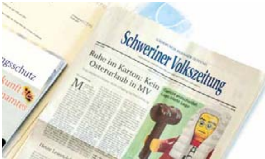
„Ruhe im Karton: Kein Osterurlaub in MV“, SVZ vom 25. März 2021

dass Grundrechte der Bürger nur so weit eingeschränkt würden, wie unbedingt nötig. Seine Empfehlung deshalb: Den Gesetzentwurf nicht zur weiteren Beratung in die Ausschüsse zu überweisen.