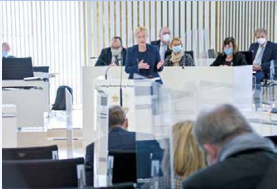
Ministerpräsidentin Manuela Schwesig während der Regierungserklärung am 24. März.