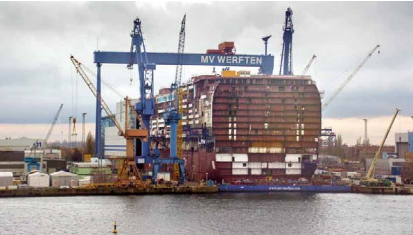
MV Werften Rostock/Warnemünde