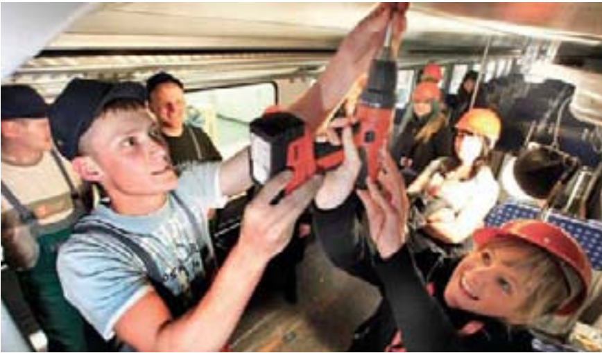
Im März debattierte der Landtag über Geschlechterstereotype sowie geschlechtstypische Berufe. Am jährlich stattfindenden Girls' Day können sich Mädchen vermeintlich männertypische Berufe anschauen.