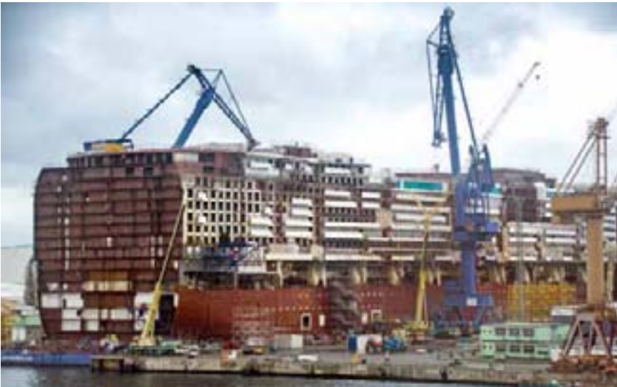
MV Werften Rostock, Dezember 2019, vor der Corona-Pandemie

ten, einen Sozialplan zu verhandeln und eine Transfergesellschaft einzurichten, unterstütze seine Fraktion deshalb ausdrücklich. Angesichts der ungewissen Zukunft der Werften müsse auch über Alternativen nachgedacht werden. Für den Fall, dass trotz aller Bemühungen ein Weiterbetrieb nicht möglich sei, müsse man vorbereitet sein. Auch das gehöre zu seriöser Politik dazu.