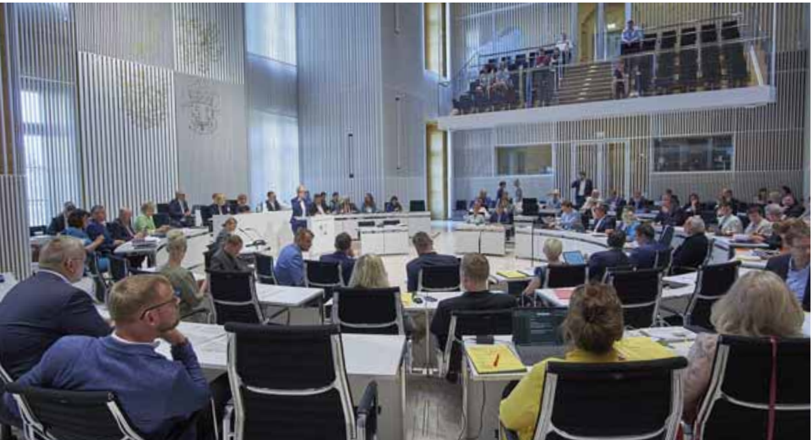
Ministerpräsidentin Manuela Schwesig während der Aktuellen Stunde