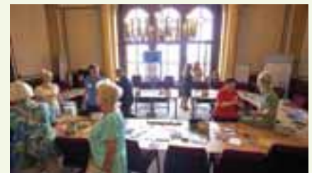
Im Sozialausschuss beantworteten die Abgeordneten die Fragen der Besucherinnen und Besucher.

zufrieden, dass das Tariftreue- und Vergabegesetz seit Jahren ein von ihrer Partei eingefordertes Vorhaben sei. „Jetzt ist es möglich, das gemeinsam in dieser Koalition umzusetzen.“ Damit könne MV im Bereich der Löhne vorankommen. „Wir wissen ja, wie das Lohnniveau ist.“ Gerade in Vorpommern kämen viele Leute angesichts der niedrigen Löhne und der hohen Energiepreise kaum über die Runden.