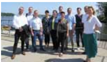
Die Ausschussmitglieder mit Vertretern des Ocean Technology Campus Rostock.

Meer der Ostsee sehr ähnlich und böte damit ein ideales Forschungsfeld für Vergleiche.