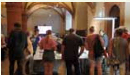
Der Bildungsausschuss präsentierte sich in der Hof Dornitz.