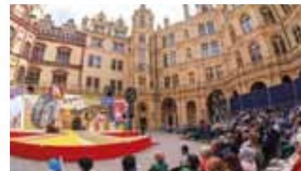
Die Bühne des Theaters für die Aufführung "Little Miss Sunshine" bot ein passendes Ambiente.

„Ich freue mich sehr, dass unser schönes Bundesland zugleich die Wahlheimat und ein Zuhause für Menschen aus so vielen verschiedenen Ländern geworden ist. Ich hoffe, dass Sie mit dieser neuen Heimat nicht nur einen Ort, sondern auch das Gefühl verbinden, endlich angekommen zu sein.“