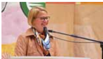
Landtagspräsidentin Birgit Hesse begrüßt alle Gäste.

Gute Wünsche der Landtagspräsidentin Birgit Hesse für diesen neuen Lebensabschnitt