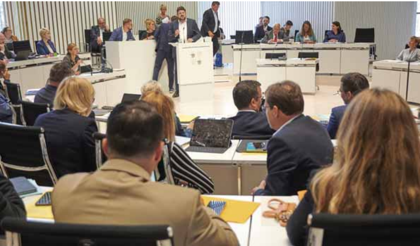
Julian Barlen (Fraktionsvorsitzender SPD) während der Aktuellen Stunde zum Thema: "Angriffe auf die Rente stoppen – Gleiche Renten in Ost und West sowie Sicherheit beim Renteneintrittsalter sind Ausdruck des Respekts vor lebenslanger Arbeit"