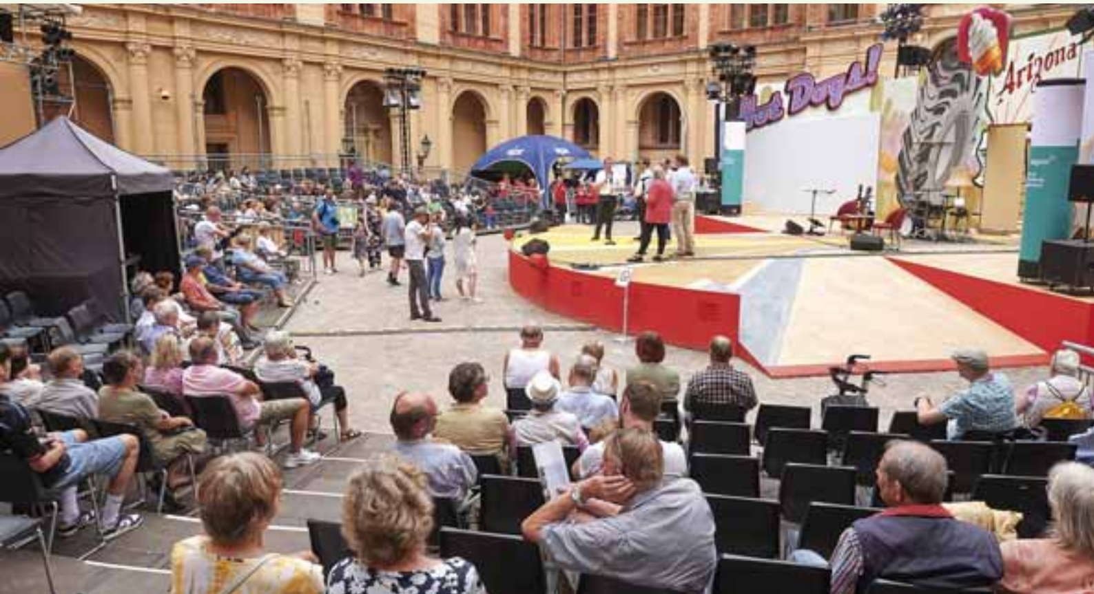
Im Innenhof unterhielt ein abwechslungsreiches Programm die Gäste.