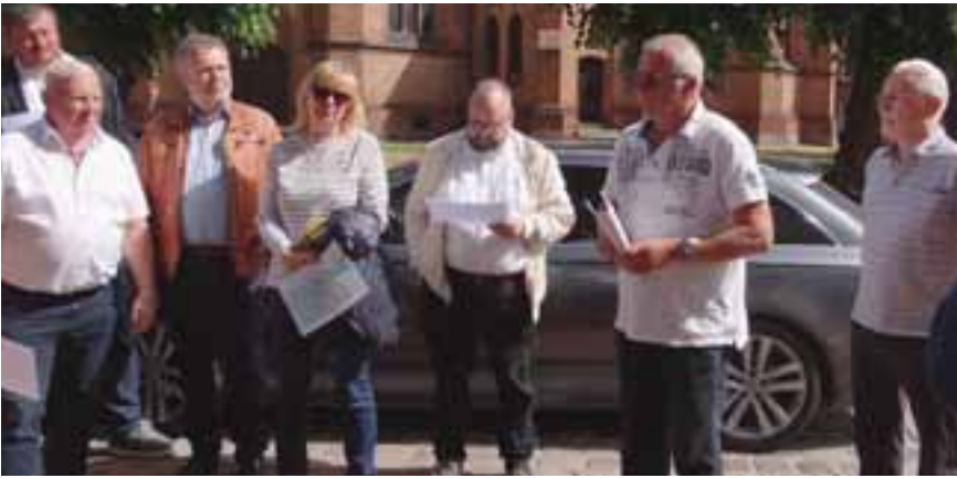
Vertreter der Bürgerinitiative "LKW Raus" im Gespräch mit dem Petitionsausschuss.