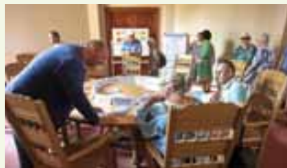
Beim Petitionsausschuss nahmen viele Gäste am Quiz teil.