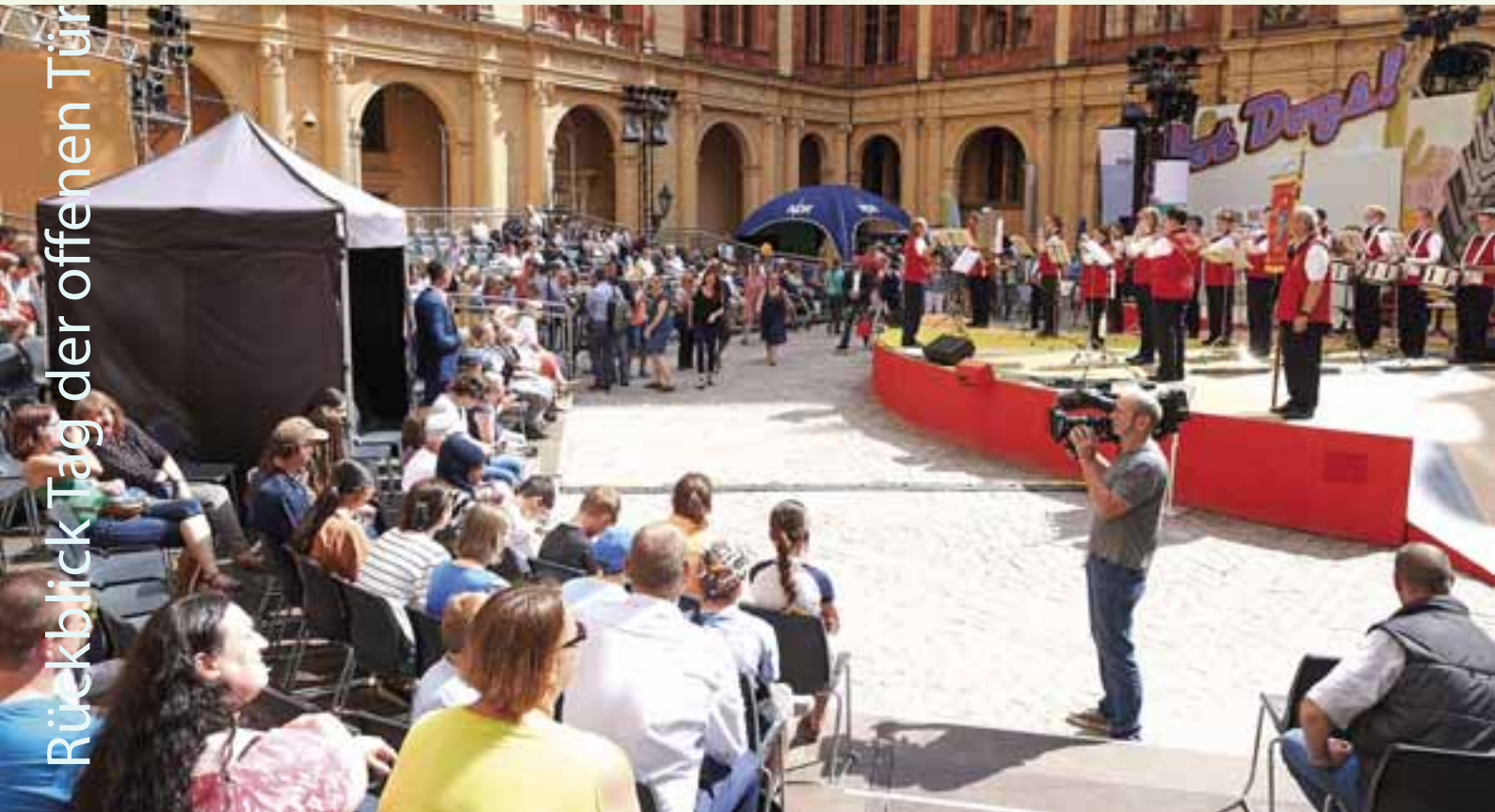
Der "Verein Schweriner Spielleute 1990 e.V." eröffnete das Bühnenprogramm im Innenhof des Schweriner Schlosses.