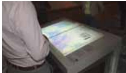
Das „lebendige“ Blätterbuch.

Nachwuchsgewinnung und die aktuellen Gegebenheiten bei der Umsetzung der Grundsteuerreform zu informieren.