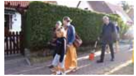
Der Vorsitzende des Petitionsausschusses, Thomas Krüger (SPD), misst die Wegstrecke.

Im Hinblick auf die geforderte Begrenzung des Schwerlastverkehrs einigten sich die ebenfalls anwesenden Vertreter der Straßenverkehrsbehörden, der Denkmalpflege, der Stadt, des Amtes und Landkreises darauf, unter Federführung der Stadt Dömitz die verkehrrechtlichen Möglichkeiten, die gegebenenfalls auch eine Ortsumgehung umfassen, zu prüfen und auf den Weg zu bringen. In Bezug auf die Zitadelle waren sich alle Beteiligten einig, dass dieses Bauwerk die Stadt Dömitz heillos überfordert. Hier erklärte sich der Landkreis bereit, mit allen Beteiligten eine Arbeitsgruppe einzurichten. Diese soll in einem ersten Schritt klären, auf welche Weise ein langfristiges Sanierungs- und Erhaltungskonzept zu erarbeiten ist, welches dann die Voraussetzung dafür bildet, in einem zweiten Schritt die langfristige Finanzierung zu sichern. Der Petitionsausschuss wird beide Petitionen weiter begleiten.