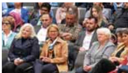
Landtagspräsidentin Birgit Hesse verfolgte das kulturelle Rahmenprogramm.

Am Dienstag wurde die Einbürgerungsfeier der Landeshauptstadt erstmals im Schweriner Schloss ausgerichtet. Landtagspräsidentin Birgit Hesse hieß die eingeladenen Gäste im Schlossinnenhof herzlich willkommen und sprach ihnen ihre Wünsche für diesen neuen Lebensabschnitt aus: