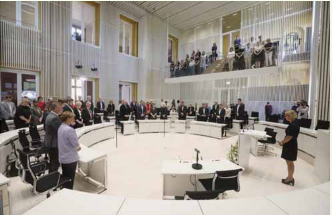
In einer Schweigeminute gedachten die Anwesenden der Opfer des 17. Juni 1953.