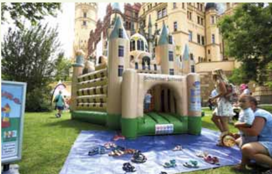
Eine Hüpfburg, gut angenommen und dem Schloss zum Verwechseln ähnlich.