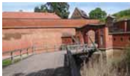
Eingangstor der Festung