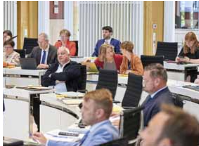
(v.l.n.r.) Abgeordnete der Fraktionen SPD, BÜNDNIS 90/DIE GRÜNEN, FDP und AfD

eine verpflichtende private Altersvorsorge, die die Riester-Rente ersetzen soll. Endlich hat die CDU scheinbar eingesehen, dass dieses Riester-Rentenmodell falsch war und auch gescheitert ist.