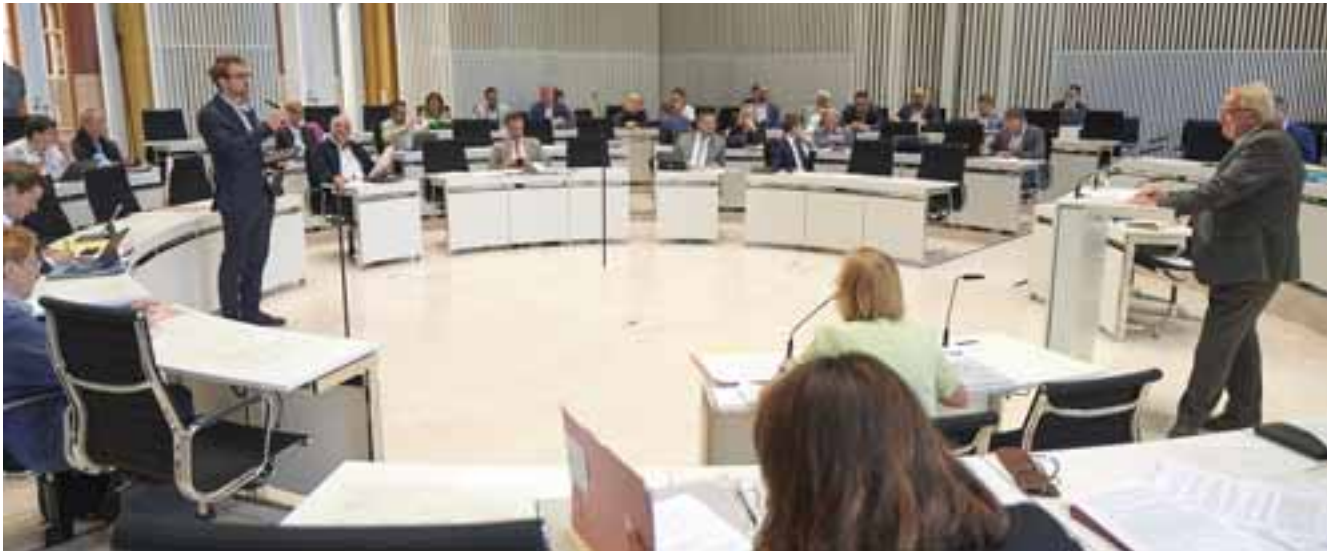
Der Abgeordnete Hannes Damm (BÜNDNIS 90/DIE GRÜNEN) befragt Landwirtschaftsminister Dr. Till Backhaus.

Der Donnerstag einer Landtags-Sitzungswoche beginnt in der Regel mit der Befragung der Landesregierung. Hierfür benennen die Abgeordneten, die eine Frage stellen wollen, im Vorfeld den Geschäftsbereich sowie das jeweilige Themengebiet ihrer Frage. Somit haben die betreffende Ministerin oder der betreffende Minister die Möglichkeit, sich vorzubereiten. Die tatsächliche Frage stellt ihnen der oder die Abgeordnete im Rahmen der Fragestunde.