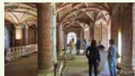
Der Weinlaubsaal an der Nordbastion ist nur zu besonderen Anlässen für die Öffentlichkeit zugänglich.

können die Menschen davon profitieren?“ Er zeigte sich zuversichtlich, dass es sich dank der Novelle des bundesweiten Energiewirtschaftsgesetzes noch mehr für die Menschen im Nordosten lohnen wird, wenn die Erneuerbaren Energien ausgebaut werden. Das Land biete eine große Zahl von Möglichkeiten, die regenerierbaren Energien zu forcieren. David Wulff (FDP) legte den Schwer-