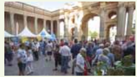
Im Vorhof des Schweriner Schlosses präsentierten sich alle Fraktionen.