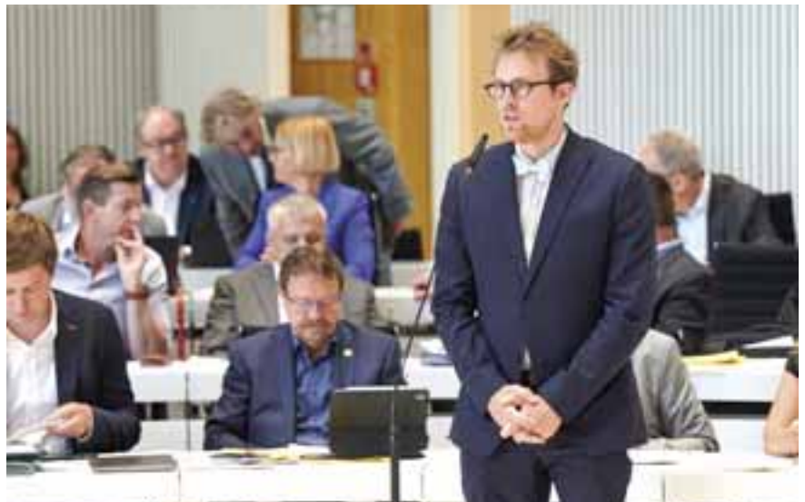
Hannes Damm (BÜNDNIS 90/DIE GRÜNEN)