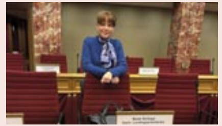
Beate Schlupp (1. Vize-Präsidentin des Landtages von Mecklenburg-Vorpommern)

Zum Auftakt tauschten sich die Präsidentinnen und Präsidenten am Vorabend mit dem früheren Präsidenten der Europäischen Kommission, Jean-Claude Juncker, über die Zukunft der EU aus. Die nichtöffentliche Sitzung am 19. Januar