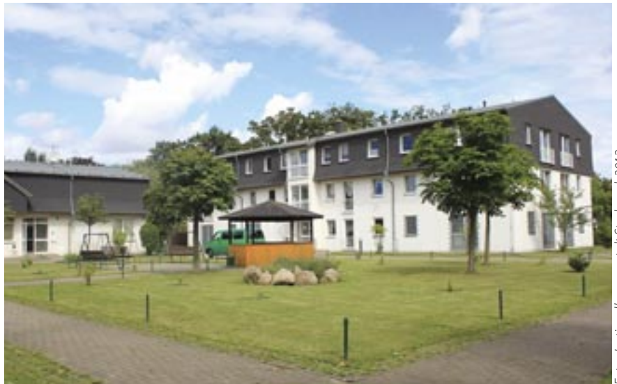
In der JVA Stralsund sind die Häftlinge, die im Offenen Vollzug sind, in einem separaten Gebäude untergebracht.

Seiner Fraktion ginge es um Verbesserungen und eine mögliche Neuausrichtung des offenen Vollzugs, erklärte Sebastian Ehlers (CDU). Denn dass es Probleme gebe, zeigen nicht allein die Rückverlegungen, sondern auch die Fälle von Nichtrückkehrern aus dem offenen Vollzug. Wer die Regeln der Gesellschaft wiedererlernen müsse, dem sei auch zuzumuten, sich an Vorgaben zu halten und pünktlich zurückzukommen. Aus Sicht von Sebastian Ehlers werde die Wichtigkeit der Resozialisierung so hoch bewertet, „dass alle weiteren Ziele einer Straftat in den Hintergrund treten“ und der Strafcharakter einer Haft verloren zu gehen drohe. Obwohl die dem offenen Vollzug zugrunde liegende Idee „eine sehr gute“ sei, erziele sie in der Praxis nicht immer die vorgestellte Wirkung. „Daraus ziehen wir nicht den Schluss, den offenen Vollzug abzuschaffen“, versicherte der Abgeordnete, aber seine Fraktion wolle ihn besser machen.