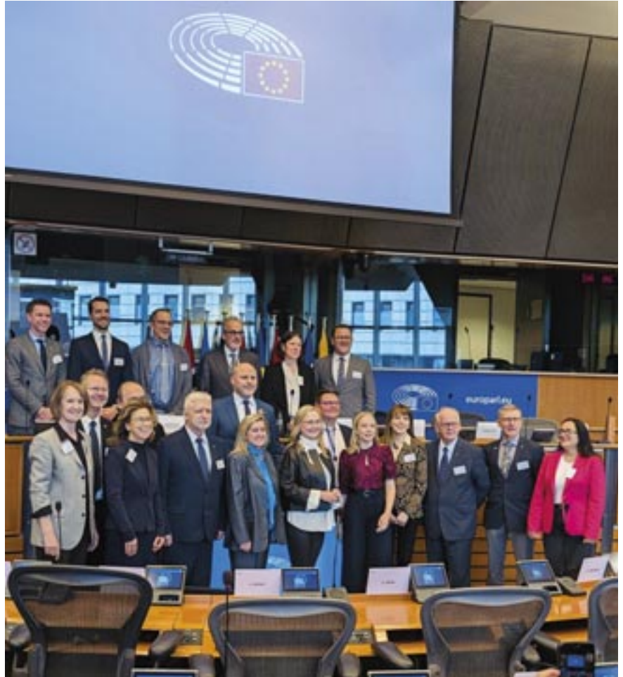
Die Teilnehmerinnen und Teilnehmer der Sitzung des Ständigen Ausschusses der Ostseeparlamentarierkonferenz (BSPC) im Europäischen Parlament.

Die Mitglieder des Ständigen Ausschusses haben sich unter der Leitung der aktuellen BSPC-Vorsitzenden und Präsidentin des Schleswig-Holsteinischen Landtages, Kristina Herbst, inhaltlich mit der geopolitischen Situation im Ostseeraum auseinandergesetzt. Dabei standen die Entwicklungen in der Arktis und rund um Grönland im Mittelpunkt. Themen waren auch: die Verhandlungen über den nächsten mehrjährigen Finanzrahmen (MFR) der EU und zu seinen Auswirkungen auf die Ostseeregion sowie über den Ausbau der Jugendbeteiligung im Rahmen der BSPC.