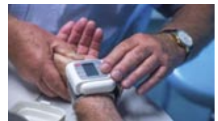
Wie kann es gelingen, mehr Ärzte in Mecklenburg-Vorpommern zu halten?

Dem Änderungsantrag von BÜNDNIS 90/DIE GRÜNEN stimmten der Antragsteller und der fraktionslose Abgeordnete Hannes Damm zu. Die CDU und die Gruppe der FDP enthielten sich. Mit den Gegenstimmen von Die Linke, SPD und AfD wurde der Antrag abgelehnt.