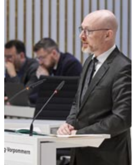
Innenminister Christian Pegel

Die GEAS-Reform, die Reform des Gemeinsamen Europäischen Asylsystems, wartet auf Umsetzung, wartet darauf, dass sie in den Ländern, in Deutschland, aber auch in den Bundesländern, in Mecklenburg-Vorpommern konkrete Anwendung finden wird. Wir lesen in den letzten Wochen, dass es da einen Streit gibt, dass die Vereinbarungen zwischen Bund und Ländern, was die Anpassung, was die Umsetzung dieser Reform angeht, nicht wirklich vorankommen. Herr Minister, es wird sogar bei der Innenministerkonferenz davon gesprochen, dass erhebliche Risiken für eine fristgerechte Umsetzung der Asylgrenzverfahren bestehen würden. Es geht dabei um Finanzierungsfragen vor allem.