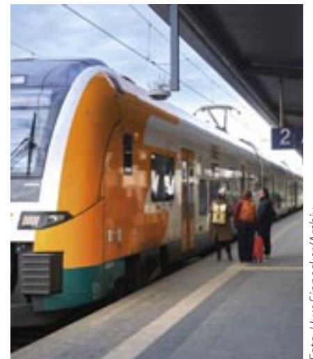
Regionalbahn, Hauptbahnhof Schwerin