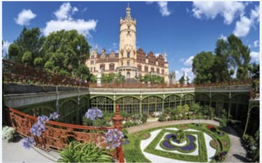
Die Orangerie am Schweriner Schloss vermittelt mediterranes Flair.

Genießen Sie einen entspannten Rundgang um die Schlossinsel und lernen Sie mehr über die Architektur, Flora und Fauna des Burggartens kennen. Ein Höhepunkt ist die Orangerie mit wunderbarem Blick auf den Schweriner See. Diese kostenpflichtige Führung dauert etwa 60 Minuten und ist bei guter Witterung täglich nach Absprache zwischen 9 Uhr und 19 Uhr möglich. Führungen für Gruppen bis zu 10 Personen kosten 80 Euro, für bis zu 20 Personen 110 Euro.