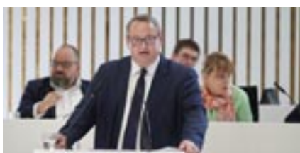
Tilo Gundlack (SPD)