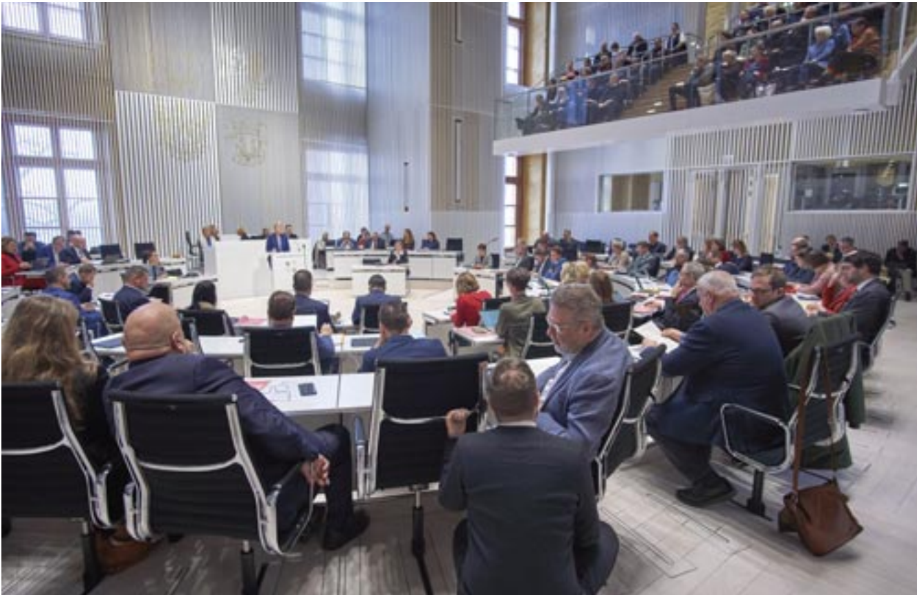
Ministerpräsidentin Manuela Schwesig am Rednerpult