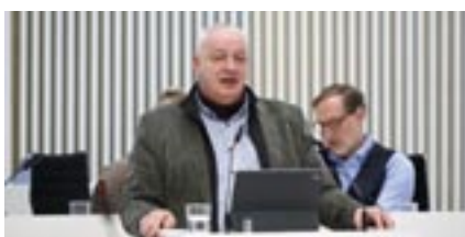
Dr. Harald Terpe (BÜNDNIS 90/DIE GRÜNEN)