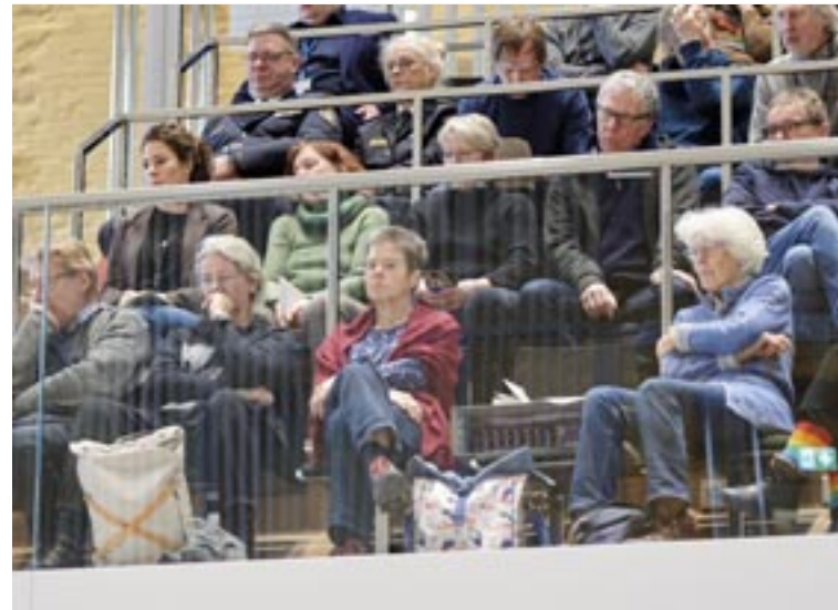
Gäste aus dem Ehrenamt und der Ehrenamtsstiftung verfolgen die Landtagssitzung

[...] auch die Freiwilligen Feuerwehren, das Thema Brandschutz, all das ist genannt worden, und jetzt müssen wir mal ehrlich schauen, was ist denn da gerade passiert. Diejenigen Ehrenamtler übernehmen teilweise pflichtige Aufgaben. Das sind pflichtige Aufgaben auf der gemeindlichen Ebene. Wenn