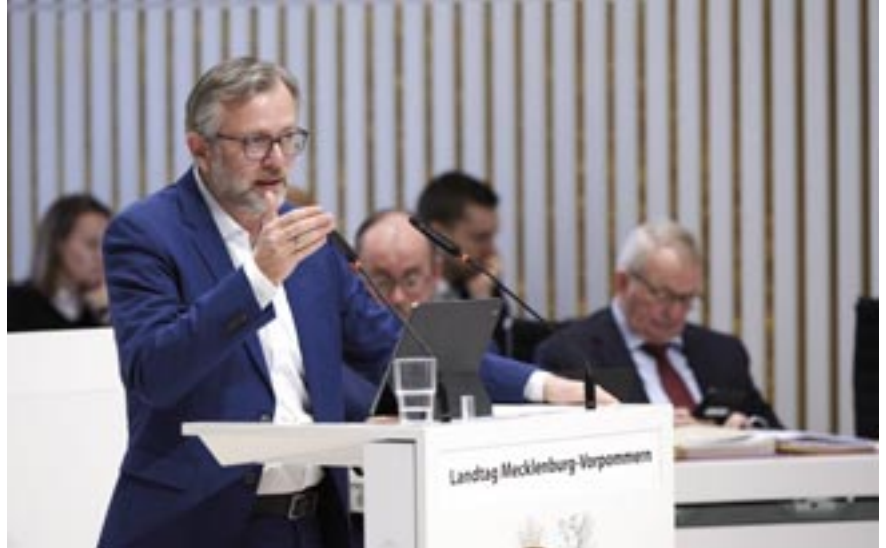
Minister Dr. Heiko Geue

Und jede Demonstrationssituation im Land kann so eine Besonderheit erfüllen, wenn es, noch einmal, ein besonderes Gefahrenpotenzial gibt, eine besondere Situation, dass Bundesbehörden massiv eingebunden werden müssen. Sie werden kein abstrakt einzelnes Merkmal haben und sagen, diese Versammlung ist es immer, sondern Sie haben die Möglichkeit bei Dingen, die besonders herausgehoben sind, die also nicht der durchschnittlichen Demonstrationssituation entsprechen, genauso, wie Sie es im Übrigen in Dutzenden anderen Gesetzen auch haben. Der Begriff der „besonderen Lage“ ist jetzt kein völlig außerordentlicher auslegungsbedürftiger Rechtsbegriff, den es in vielen Bereichen gibt. Die Möglichkeit besteht dann, wenn eine Versamm-