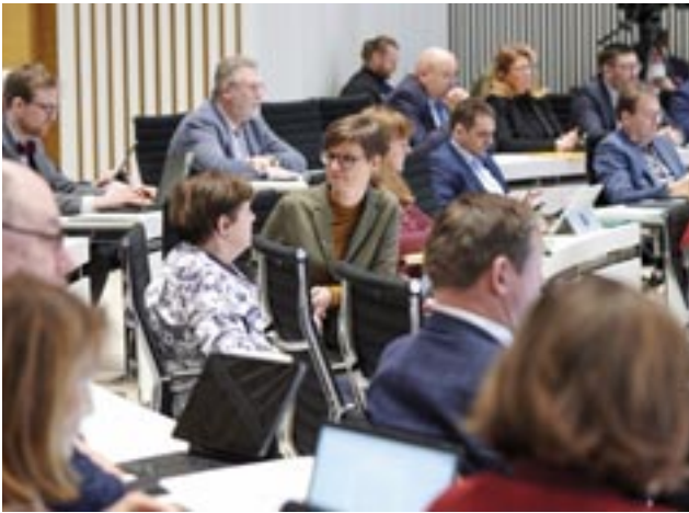
Abgeordnete der Fraktionen SPD, BÜNDNIS 90/DIE GRÜNEN und CDU

rer ganzen Vielfalt noch besser als bisher schützen und noch mehr als bisher stärken.