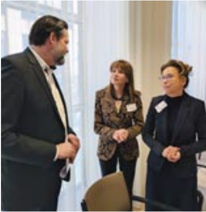
Beate Schlupp (Mitte, 1. Vizepräsidentin des Landtages MV) und Carola Veit (rechts, Präsidentin der Hamburgischen Bürgerschaft) im Gespräch.

Sicherheit, Zusammenarbeit und Jugendbeteiligung im Fokus