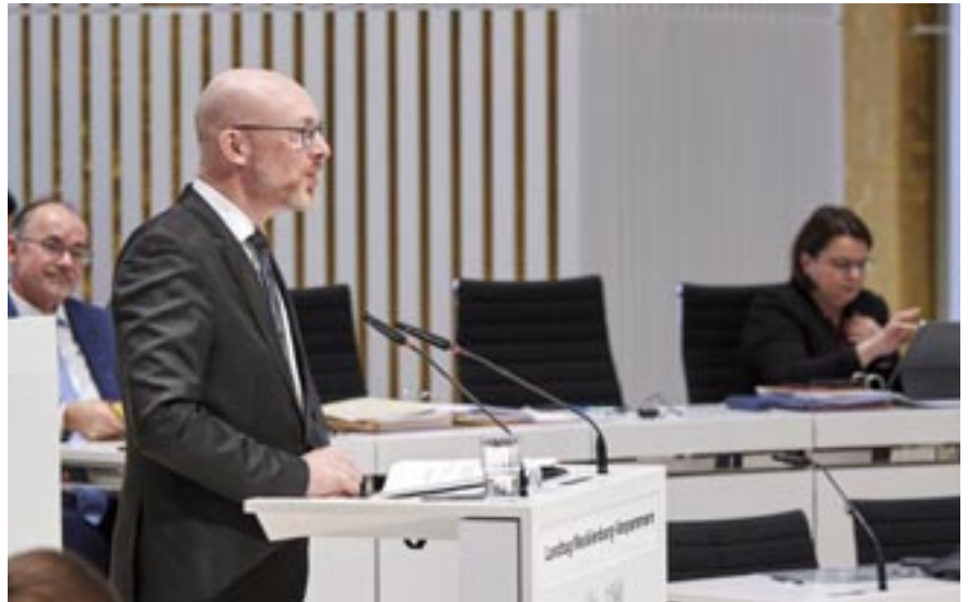
Innenminister Christian Pegel

Allerdings, und das war lange der Streit, der Bund hat bisher gesagt, das ist eure Länderproblematik, er scheint jetzt, das ist das Signal, die Kostentragungspflicht – weil es eben eine bundespolizeiliche Aufgabe ist, bei der wir nur helfen würden, indem wir dann medizinische Einrichtungen bereitstellen –, er scheint jetzt dazu umzuschwenken, die Kostentragungspflicht des Bundes zu bestätigen. Und dann wird es jetzt darum