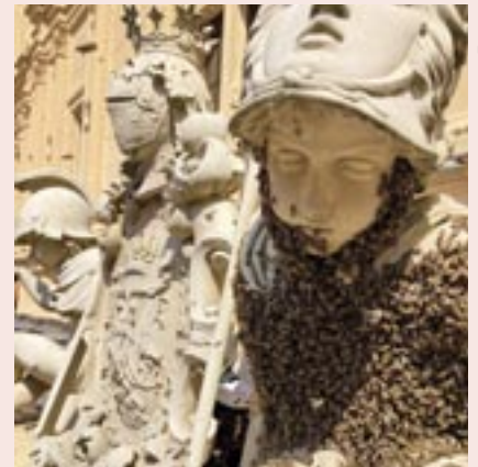
Im Juni 2025 verließen die Bienen ihren Bienenstock und schwärmten.

Ernte trotz des trockenen Frühjahrs mit 25 kg Jahrestracht durchaus beachtlich war, so dass 85 Honiggläser gewonnen werden konnten. Diese werden bei besonderen Anlässen durch den Landtag Mecklenburg-Vorpommern verschenkt. Besonders zu erwähnen ist die hohe Qualität des Schlosshonigs. Dank der traditionellen Verarbeitung mittels Schleudern und Pressen gelangen die zahlreichen gesunden Bestandteile wie beispielsweise Propolis in den Honig. Die