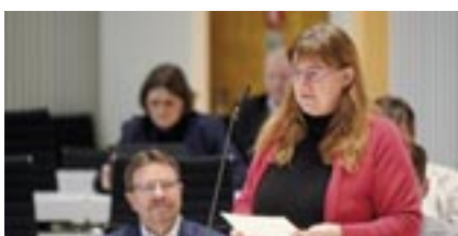
Jutta Wegner (BÜNDNIS 90/DIE GRÜNEN)