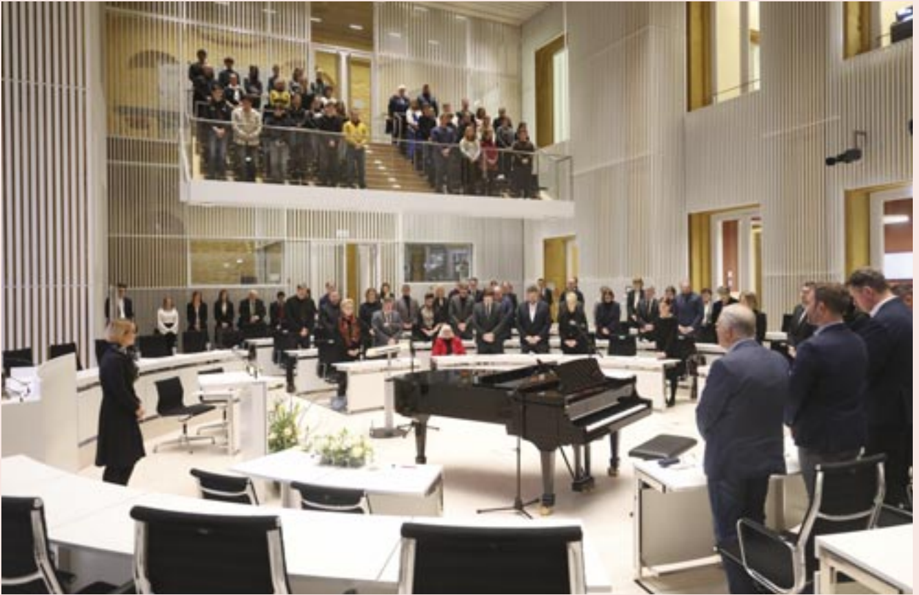
Im Rahmen der Gedenkstunde wurde mit einer Schweigeminute der Opfer des Nationalsozialismus gedacht.

■ Anlässlich des Tages des Gedenkens an die Opfer des Nationalsozialismus hat der Landtag Mecklenburg-Vorpommern am 27. Januar zu einem Gedenkkonzert mit dem Titel „Stimmen des Holocaust“ in den Plenarsaal des Schweriner Schlosses eingeladen.