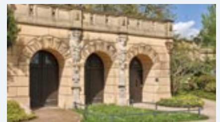
An dieser Stelle befand sich im 19. Jahrhundert ein Küchen-Versorgungskanal mit Verbindung zum Schweriner See.