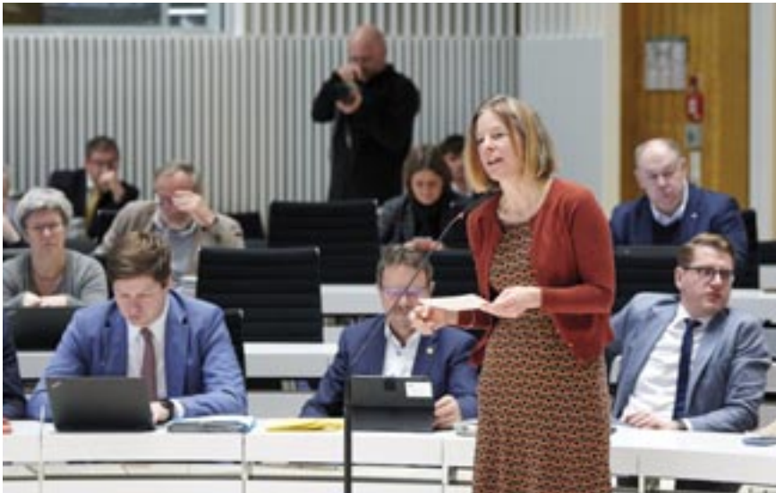
Constanze Oehlich, BÜNDNIS 90/DIE GRÜNEN