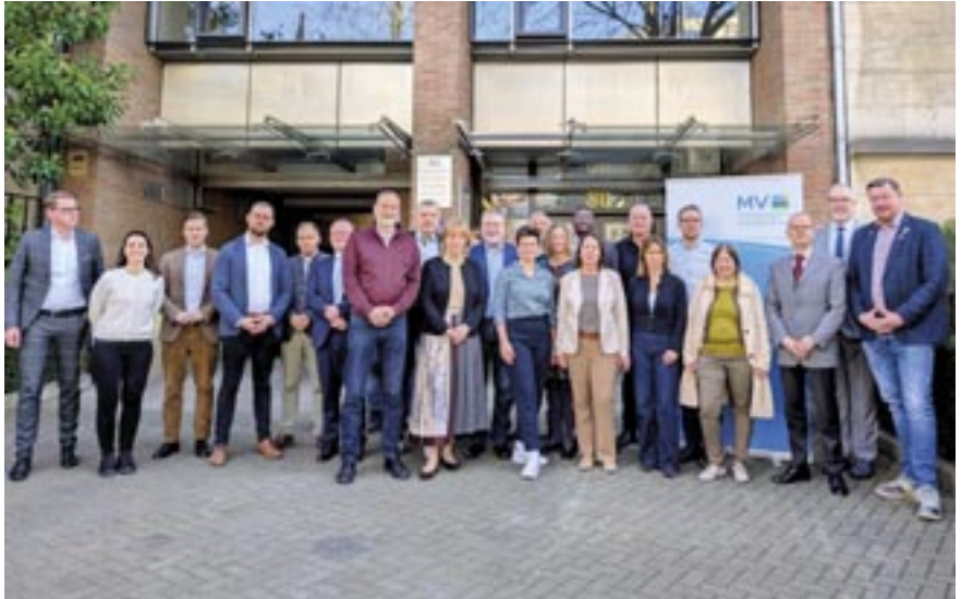
Die Mitglieder des Rechts- und des Agrarausschusses während ihres Besuchs in Brüssel.