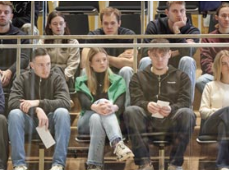
Studierende der FH Güstrow auf der Besuchertribüne