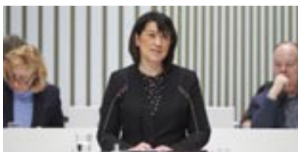
Justizministerin Jacqueline Bernhardt