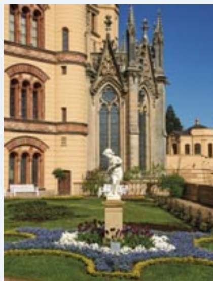
Zahlreiche Skulpturen laden zum Verweilen ein.