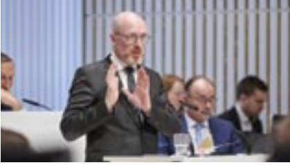
Minister Christian Pegel