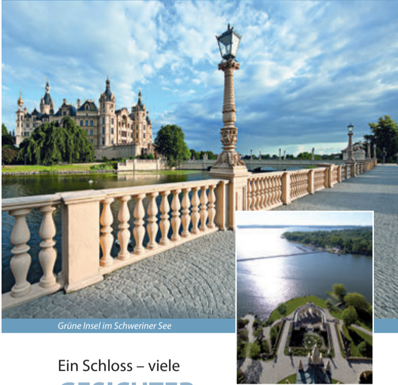
Grüne Insel im Schweriner See