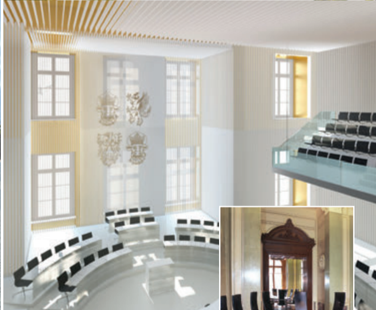
Der neue Plenarsaal