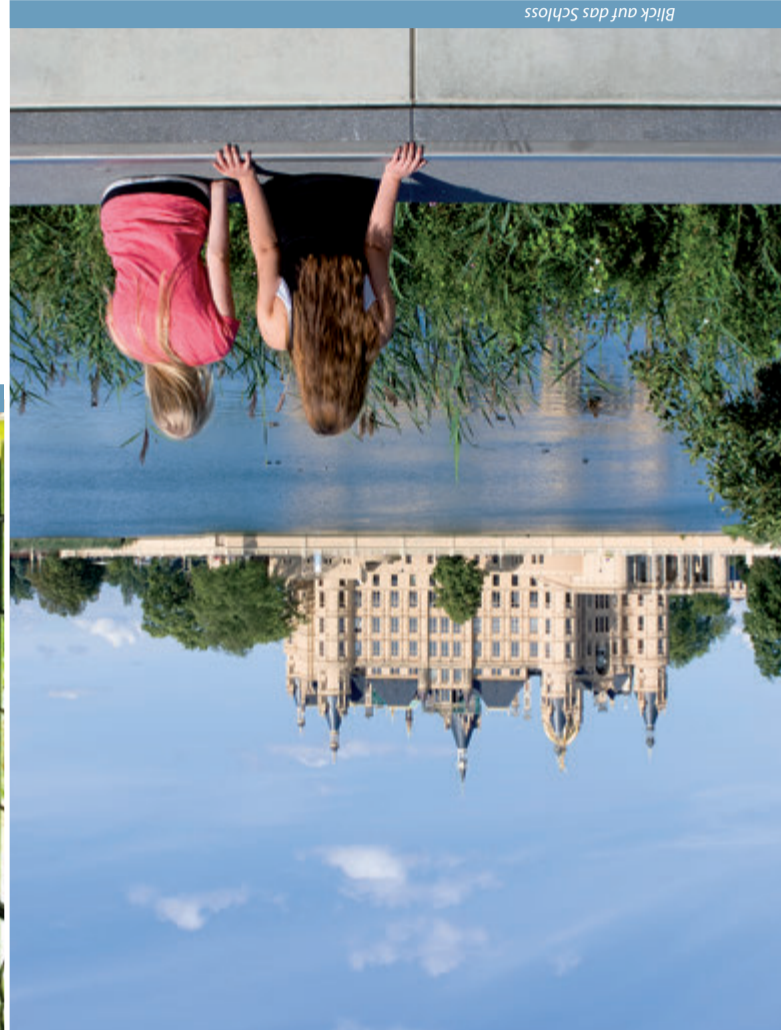
Blick auf das Schloss

Heute können über 30 Wohn-, Gesellschafts- und Prunkräume, darunter Thronsaal und Ahnengalerie, besichtigt werden. Die prachtvollen Räume beeindrucken durch ihr reiches plastisches und malerisches Dekor und kunstvolle Intarsienfußböden. Hier präsentiert das Staatliche Museum Schwerin auf drei Etagen kostbare Gemälde, Skulpturen und Kunsthandwerk vor allem des 19. Jahrhunderts. Besondere Akzente setzen die Porzellansammlung in den einstigen Kinderzimmern, die umfangreiche Kollektion fürstlicher Waffen in der Hofdornitz sowie die 2014 fertiggestellte Silberkammer mit weit über hundert Einzelstücken wertvollen Tafelgeräts des 19. und frühen 20. Jahrhunderts.