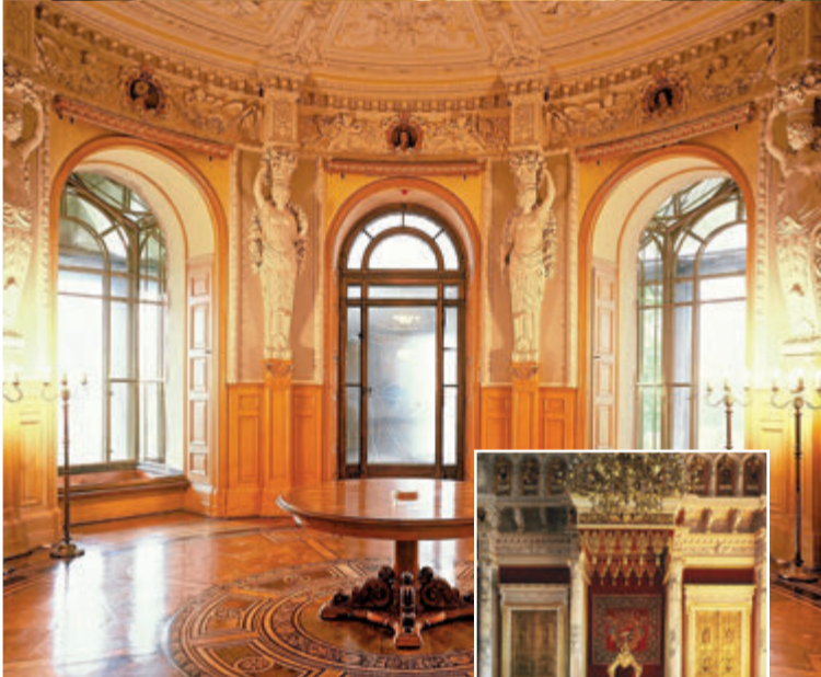
Blumenzimmer im Schlossmuseum