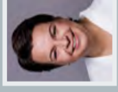
Stefanie Drese Sozialministerin