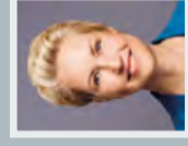
Manuela Schwesig Ministerpräsidentin