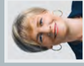
Simone Oldenburg Bildungsministerin