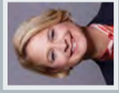
Brigitt Hesse Präsidentin des Landtages