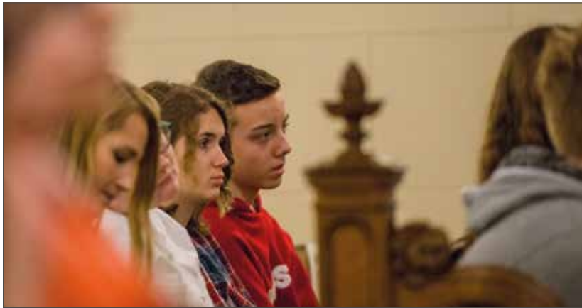
Zu den Gästen der Gedenkstunde gehörten auch Schülerinnen und Schüler aus Schwerin.

zu sichern. Wir dürfen nicht zulassen, dass die Erinnerung an die Verbrechen von Menschen an Menschen in der NS-Zeit jemals verdrängt wird oder Gleichgültigkeit sie verblassen lässt. Das ist das Vermächtnis der Opfer aller totalitärer Diktaturen, aus Kriegen und Gewalt weltweit.