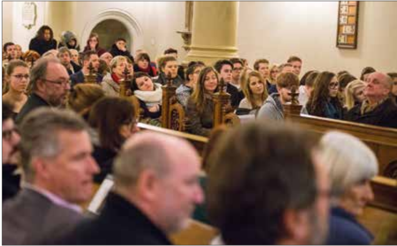
Gäste der Gedenkstunde waren neben Abgeordneten des Landtages zahlreiche Vertreter des öffentlichen Lebens sowie Schülerinnen und Schüler.

Zeit von 16 bis 17 Uhr. Ein Ausgehverbot für Juden ab 20 Uhr wurde erlassen; es wurde ihnen verboten, mit Wehrmachtsangehörigen zu sprechen, gleichfalls wurde die Bannmeile für Juden vom Regierungsviertel auf alle Fernbahnhöfe erweitert. Die Lebensmittelkarten der Juden wurden mit dem großen „J“ bedruckt, die einzelnen Abschnitte der Karte wurden in Rotschrift mit „Jude, Jude, Jude“ gekennzeichnet.