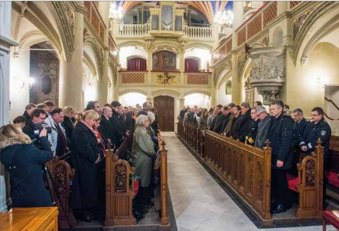
Mit einer Schweigeminute gedachten die Gäste der Gedenkstunde der Opfer des Nationalsozialismus.