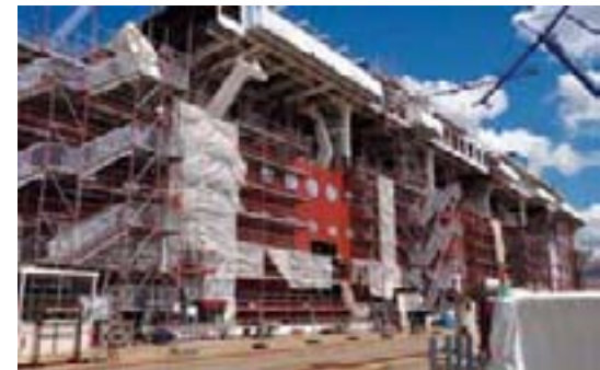
10 Decks sind schon errichtet, 10 folgen noch.

Noch einmal zehn Decks würden oben draufkommen. Das fertige Mittelstück müsse später dann auf der Werft in Wismar noch mit dem Bug und dem Heck verbunden werden. Die Gesamtlänge betrage dann 342 Meter.