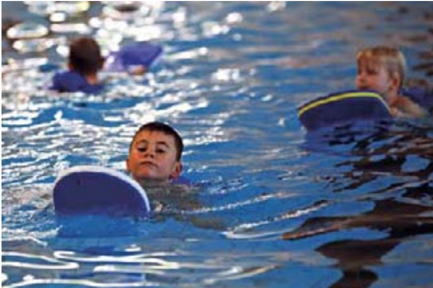
Am Ende der Grundschule sollen laut Lehrplan alle Kinder schwimmen können.