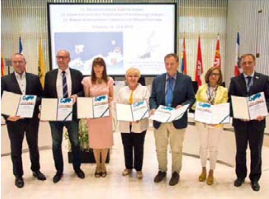
Präsentation der Abschluss-Resolution