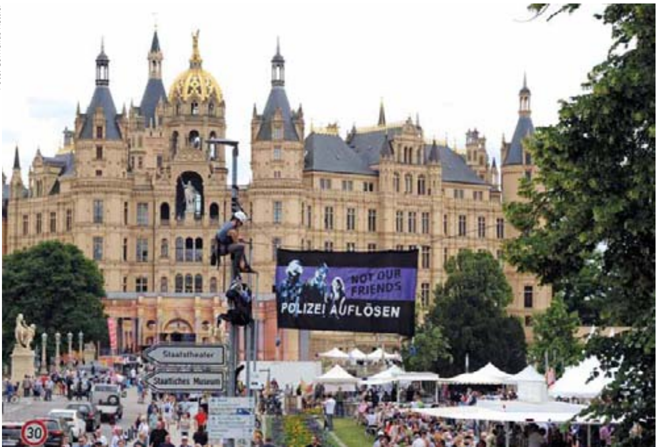
Das Sicherheits- und Ordnungsgesetz war Mitte Juni auch Anlass zu einer Demonstration vor dem Schweriner Schloss.