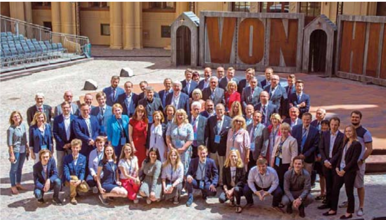
Die Teilnehmerinnen und Teilnehmer des 17. PSO und des Jugendforums