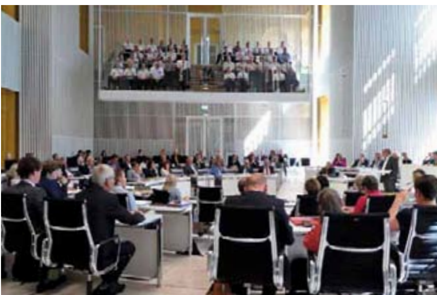
Die Tribünen waren zur Debatte über die Vorfälle bei der Polizei gut gefüllt.