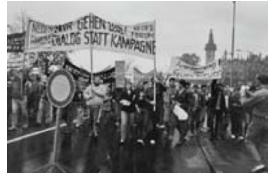
1989 gingen auch in Schwerin viele Bürgerinnen und Bürger auf die Straßen.

Dringlichkeitsantrag Freie Wähler/BMV Drucksache 7/3767