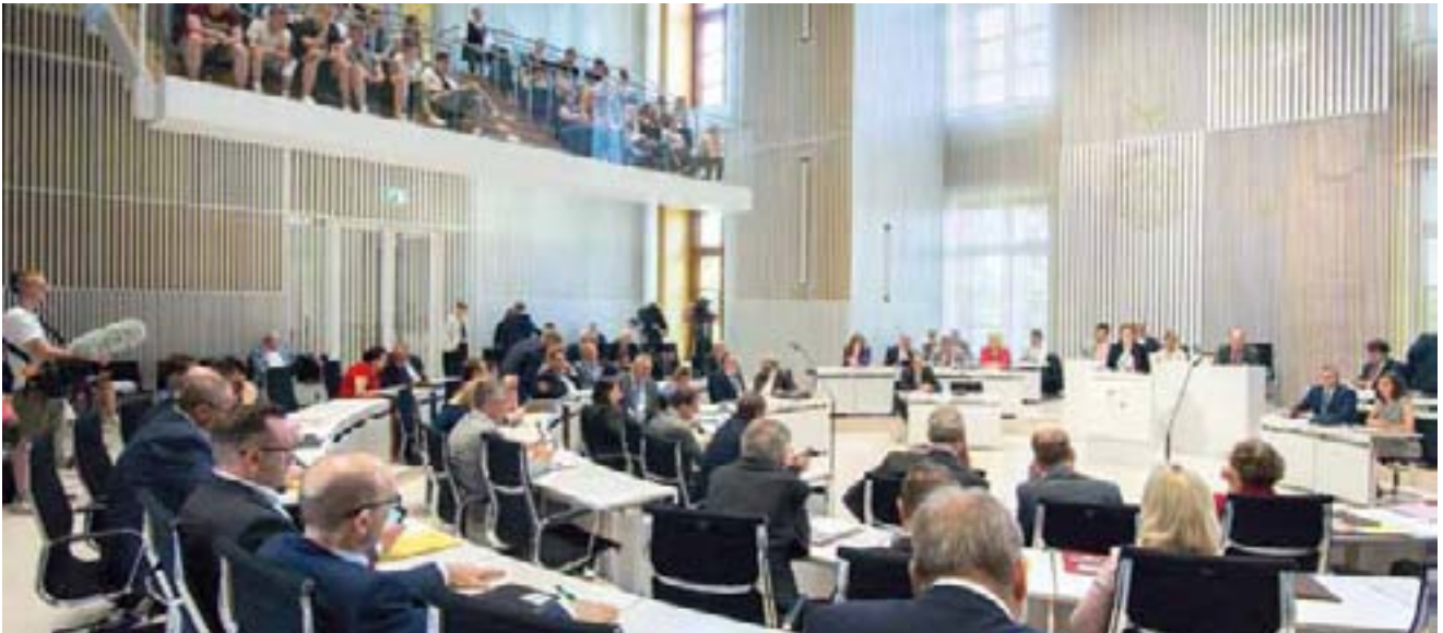
In der Aktuellen Stunde debattierten die Abgeordneten über den Klimaschutz.