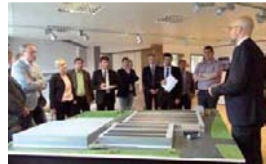
Finanzausschuss und Wirtschaftsausschuss informieren sich über die Kabinenfertigung am Model des Betriebes.

Die Resolution finden Sie unter www.landtag-mv.de/landtag/ausschuesse/blickpunkt-europa-und-internationales.html .