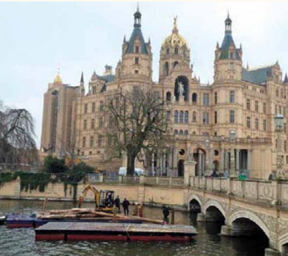
Ein Teil der Arbeiten vor dem Hauptportal erfolgte vom Wasser aus.