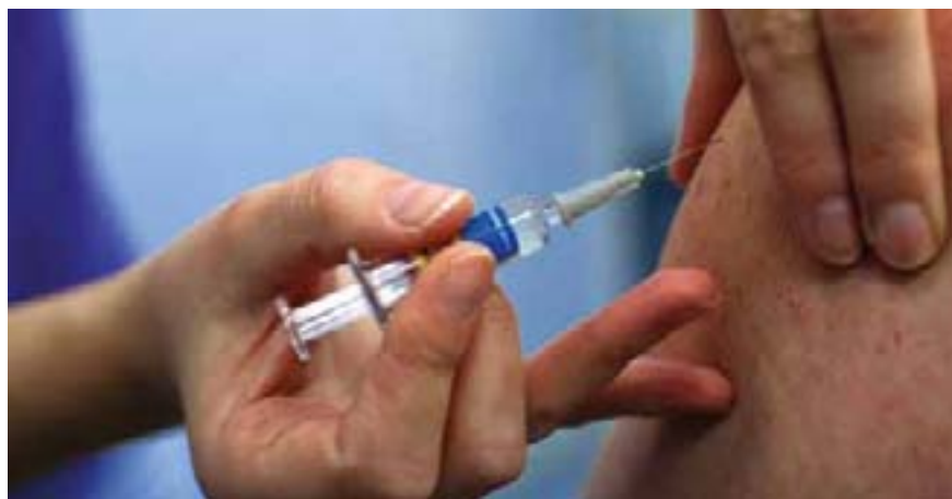
Eine Impfung kann vor der Krankheit Masern schützen.

Der Landtag unterstützt Pläne des Bundes, eine Impfpflicht für Masern einzuführen. SPD, CDU, DIE LINKE und Freie Wähler/BMV verwiesen auf die Notwendigkeit einer hohen Impfquote und forderten in einem gemeinsamen Antrag die Landesregierung auf, die Initiativen des Bundes zu unterstützen. Hier gehe es nicht um individuelle Ent-