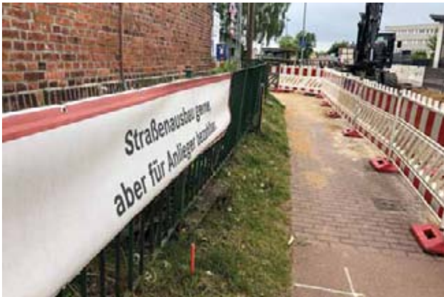
Klare Worte in der Rogahner Straße in Schwerin