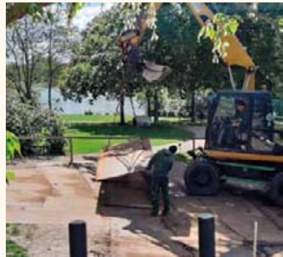
Bis die neue Entnahmestelle an der Drehbrücke fertig war, mussten für den Notfall Stahlplatten als Weg zum See verlegt werden.